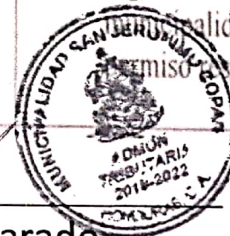
Néstor Alvarado Jefe control tributario

La Autonomía Municipal, es el derecho de los pueblos a decidir su propio desarrollo