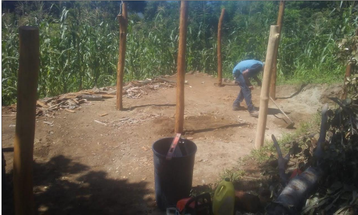
PREPARACION DEL TERRENO PARA CONSTRUCCION DE GRANJA AVICOLA

Barrio el Centro San Francisco, Lempira Honduras C.A. Telf. 2625-51-39 Correo munisanf@yahoo.es