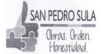
TABLA DE BIENES INMUEBLES DE LA MUNICIPALIDAD DE SPS