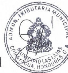
TABLA DE DOMINIOS PLENOS