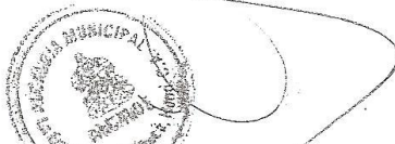
DOCTOR MIGUEL ANTONIO FAJARDO ALCALDE MUNICIPAL