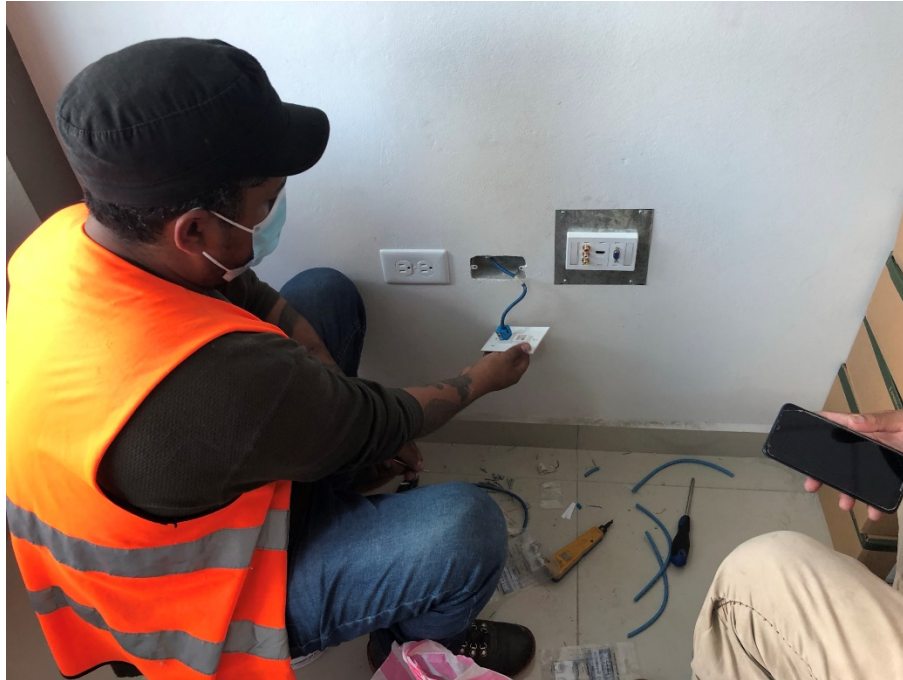
Imagen 5. Instalación de puntos de datos y HDMI