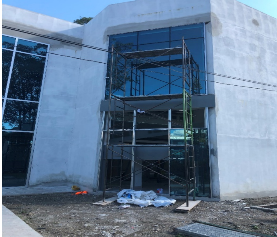
Imagen 2. Instalación de muros cortinas trasero en rampa