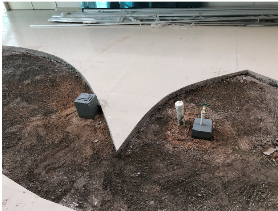
Imagen 6. Instalación de Tomas en Jardineras