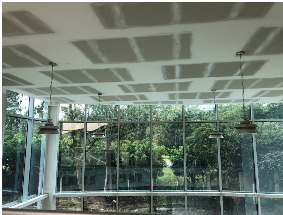
Imagen 4. Instalación de lámparas campana

Este mes continuó las instalaciones eléctricas en todo el edificio, como ser: lámparas, tomas, sistema de video, transformador de energía.