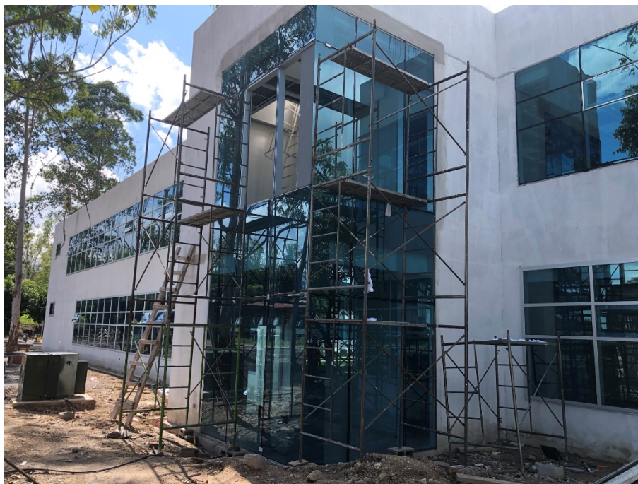
Imagen 3. Instalación de muros cortinas en cuartos eléctricos