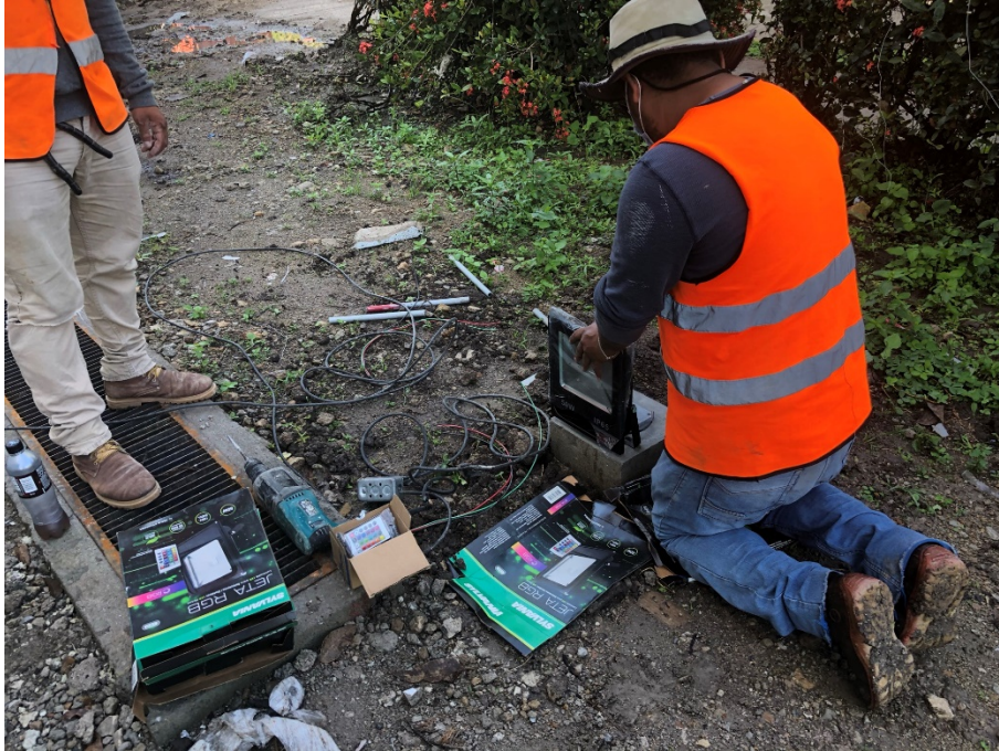
Imagen 7. Instalación de Reflectores en exteriores