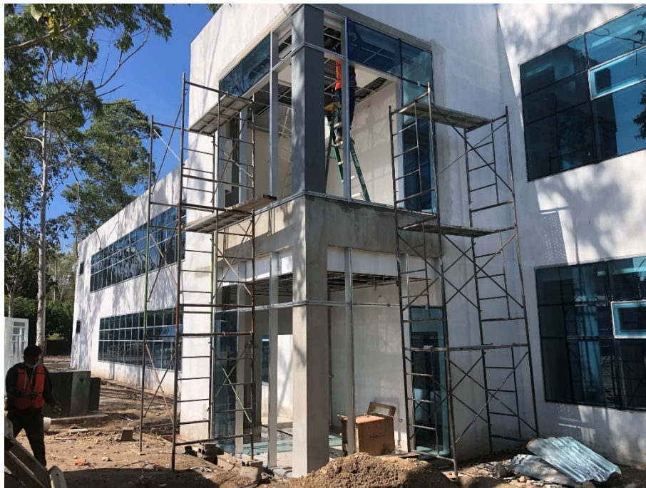
Imagen 1. Instalación de muros cortinas en cuartos eléctricos

Este mes continuó de muros cortina en todas las fachadas del edificio de aulas 50 Aniversario: