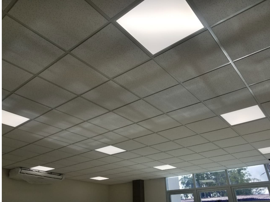
Imagen 9. Prueba de Lámparas