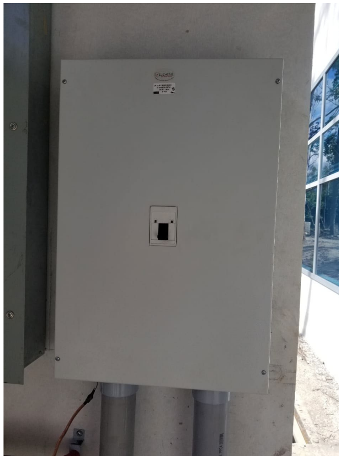
Imagen 6. Paneles Eléctricos

Este mes continuó las instalaciones eléctricas en todo el edificio, como ser: lámparas, tomas, sistema de video, transformador de energía.