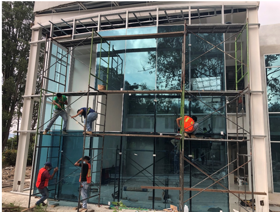
Imagen 2. Instalación de muros cortinas trasero en curva