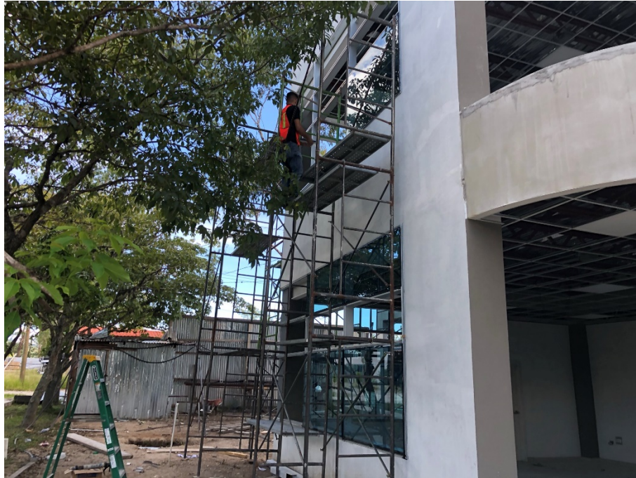
Imagen 4. Instalación de muros cortinas en fachada frontal