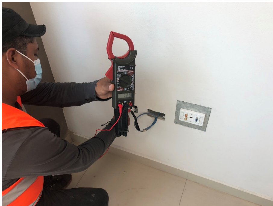
Imagen 10. Prueba de Tomacorrientes