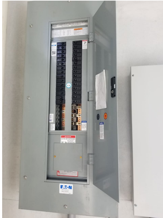
Imagen 7. Paneles Eléctricos