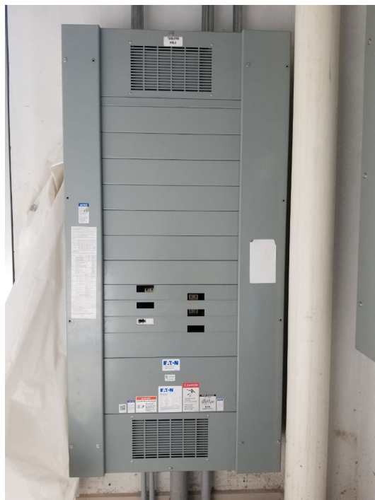
Imagen 8. Paneles Eléctricos Principales