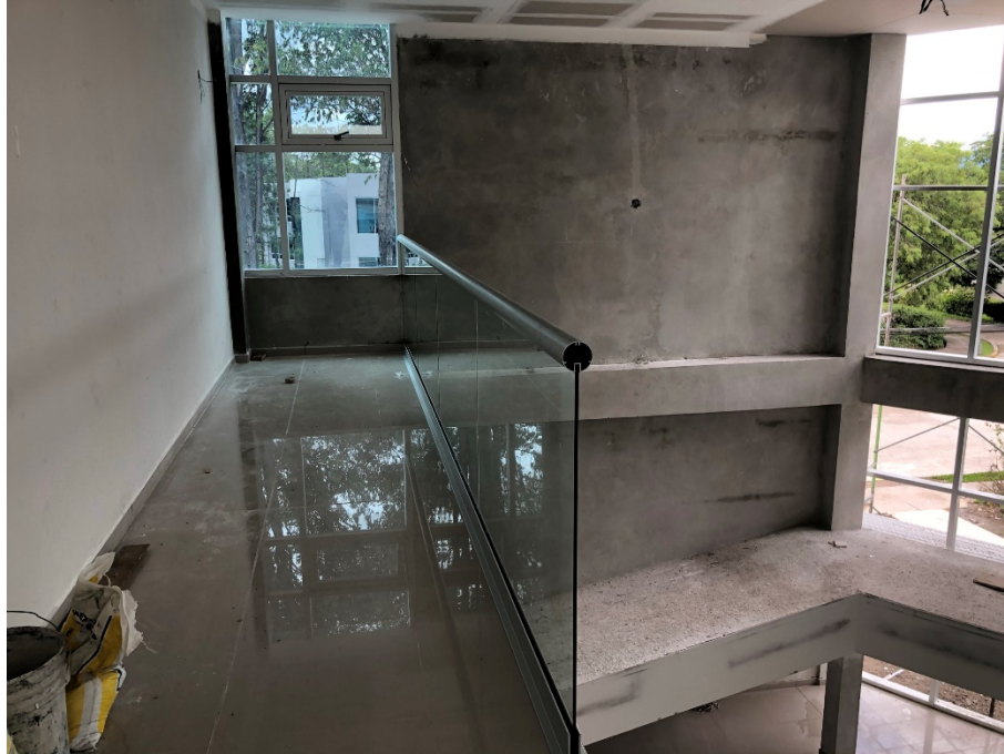
Imagen 5. Instalación de barandales de vidrio.