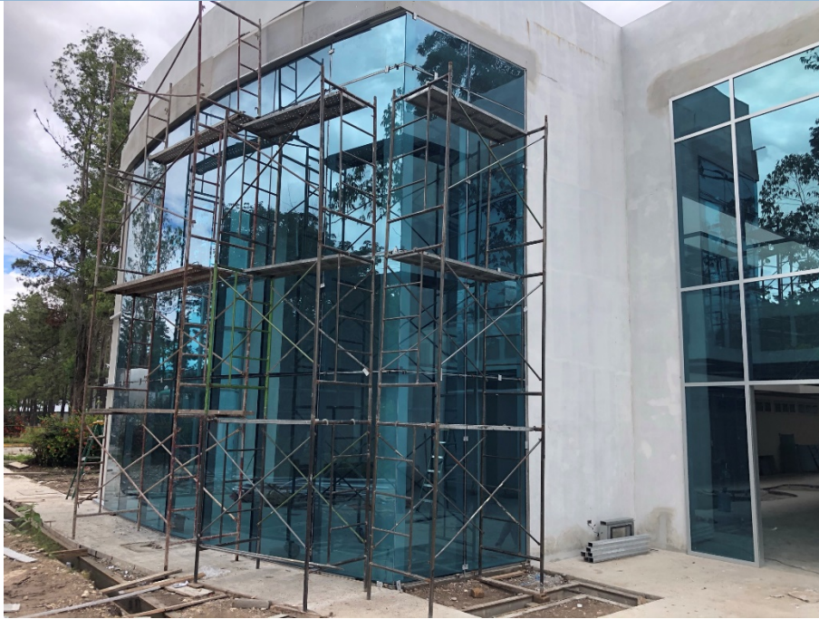
Imagen 3. Instalación de muros cortinas trasero en curva