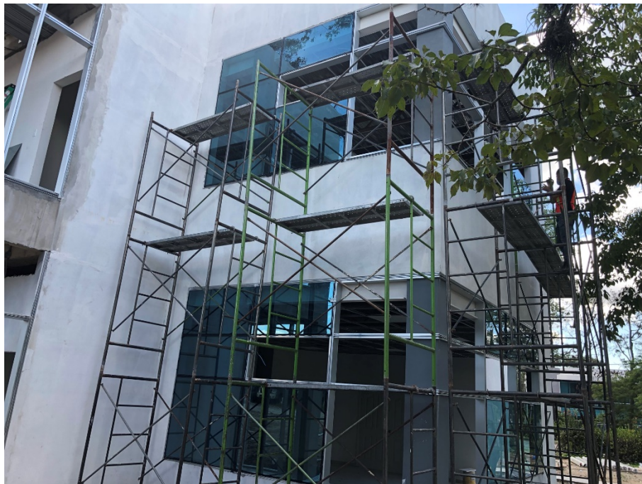
Imagen 4. Instalación de muros cortinas en fachada frontal