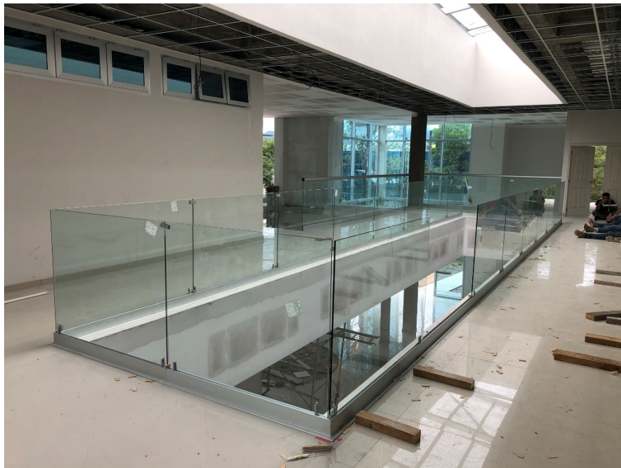
Imagen 4. Instalación de barandales de vidrio.