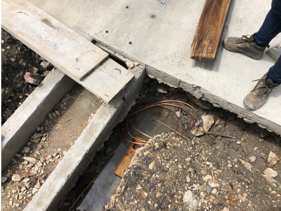
Imagen 11. Instalación de red de tierra