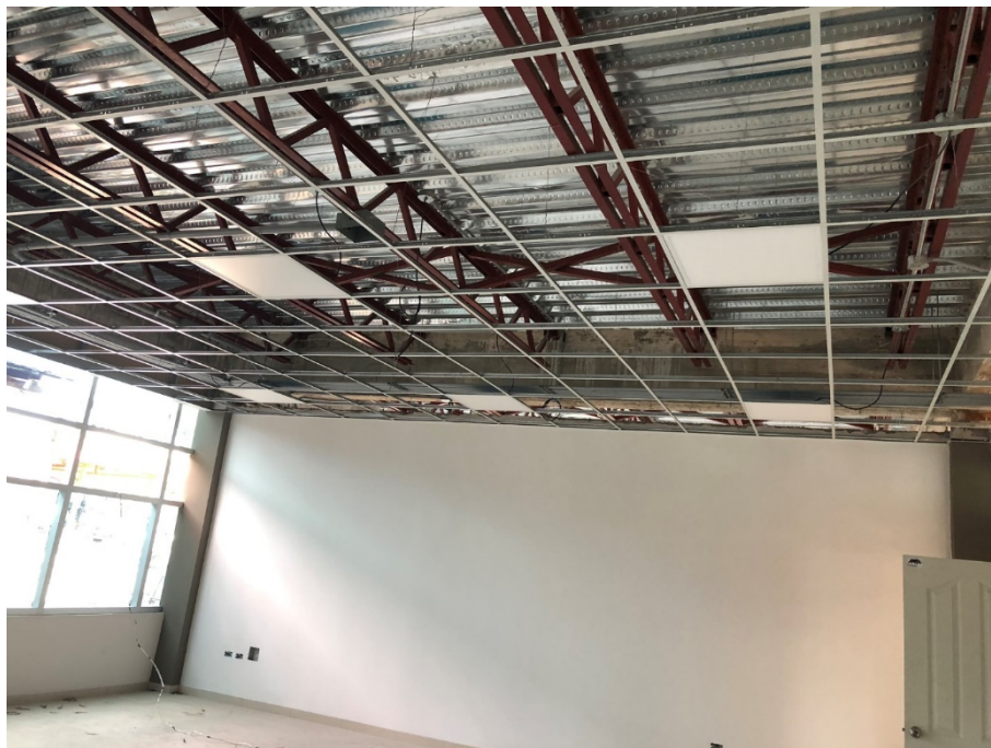
Imagen 8. Instalación de lámparas 2 x 2 en aulas.