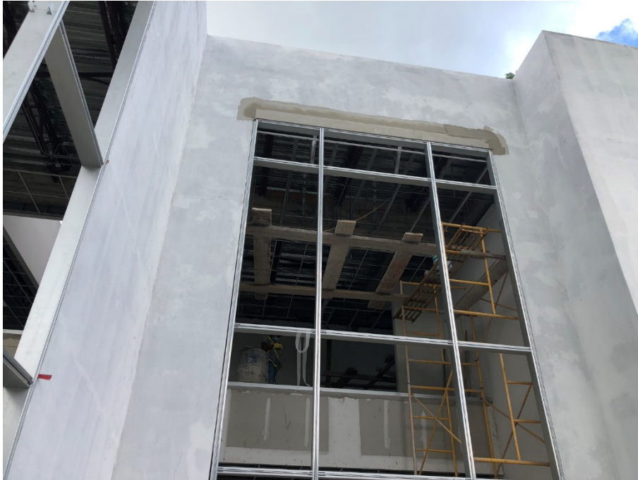
Imagen 2. Instalación de muros fachadas