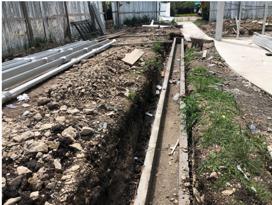
Imagen 10. Instalación de red de tierra