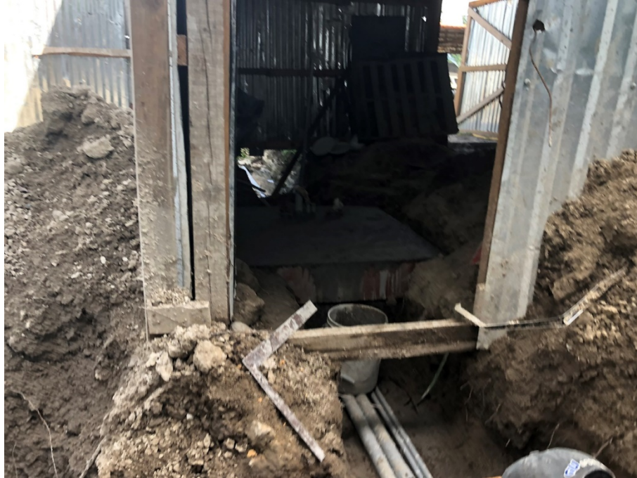
Imagen 7. Base de concreto reforzado para transformador Pad Mounted