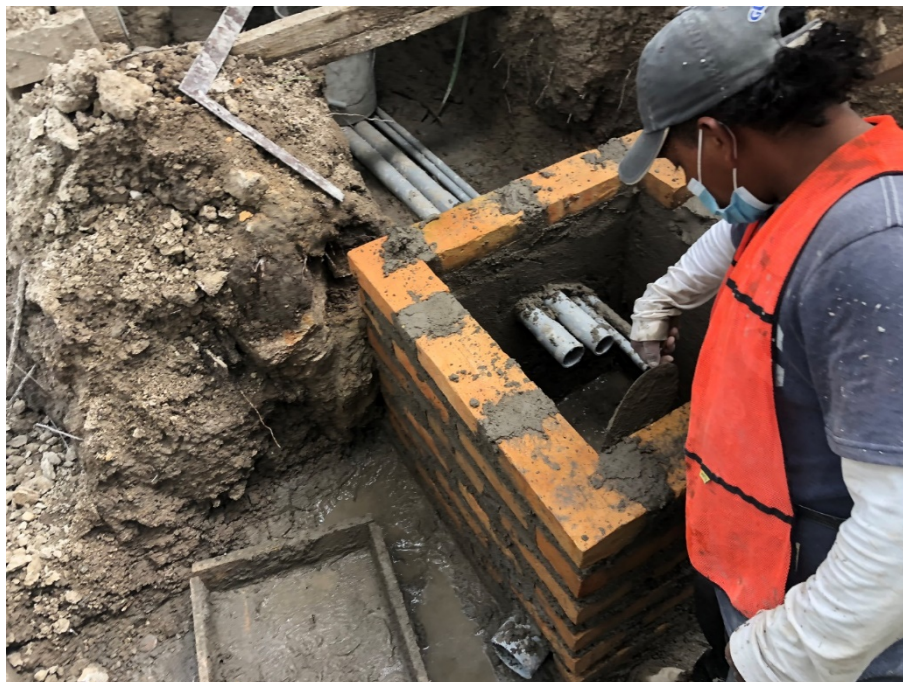
Imagen 6. Instalación de caja de registro eléctrica y de datos

Este mes continuó las instalaciones eléctricas en todo el edificio, como ser: lámparas, sistema de aterrizaje, caja de registro eléctrica, base para transformador: