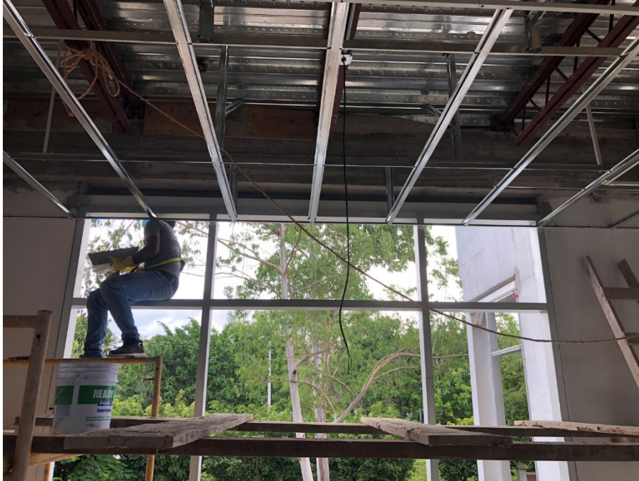
Imagen 5. Instalación de estructura de cielo de tablayeso