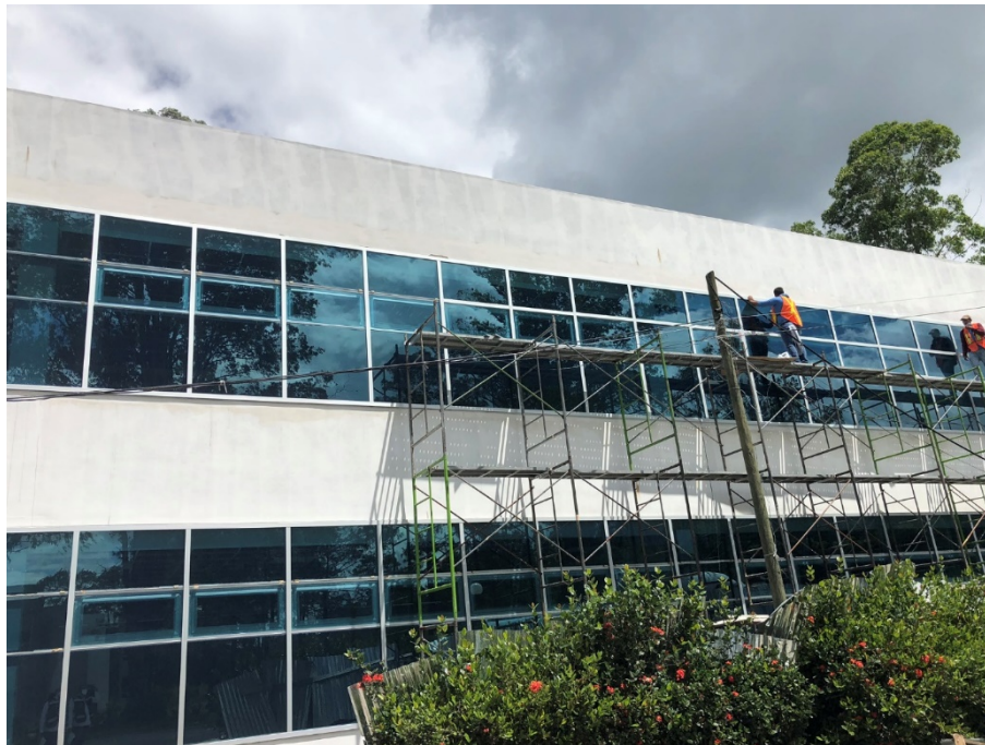
Imagen 1. Instalación de muros cortinas laterales

Este mes continuó de muros cortina en todos los niveles del edificio de aulas 50 Aniversario