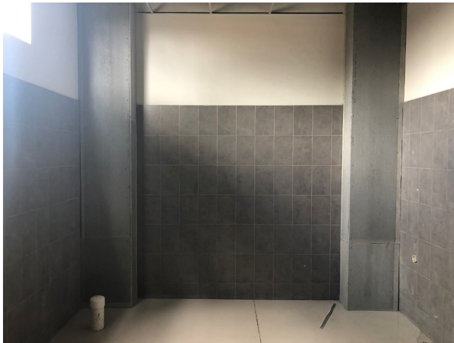
Imagen 4. Instalación de cerámica de pared en baños.