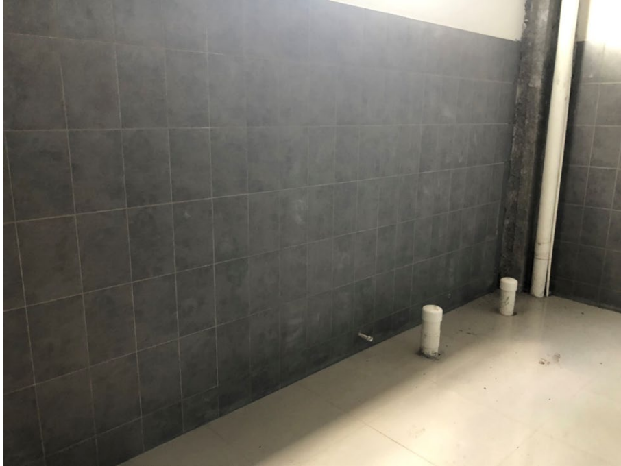
Imagen 3. Instalación de cerámica de pared en baños