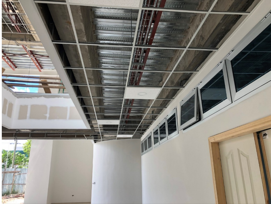
Imagen 9. Instalación de spots en pasillos.