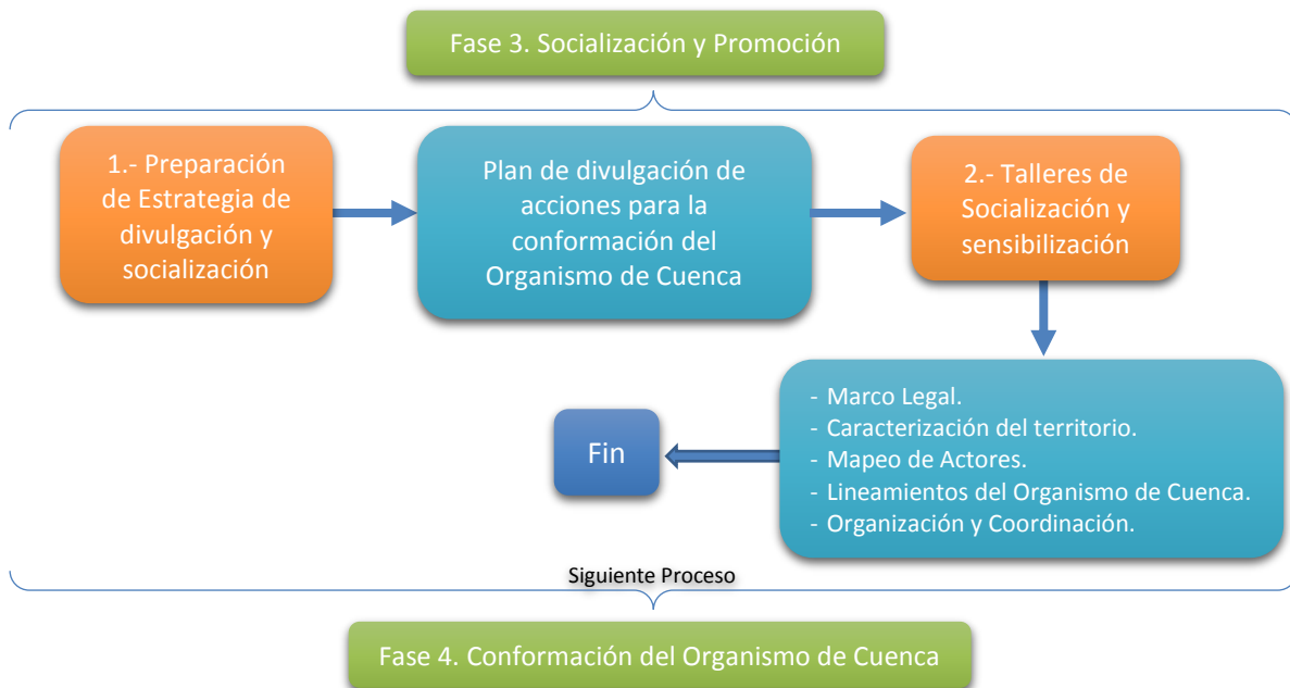
Esquema 4. Proceso de Socialización y promoción