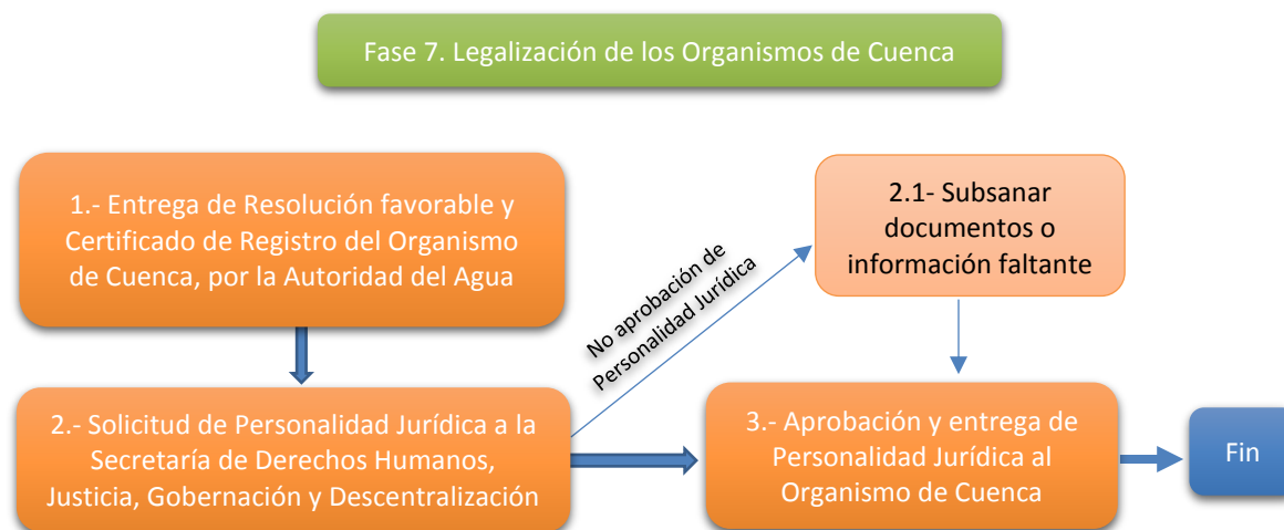
Esquema 7. Proceso de Legalización del Organismo de Cuenca

En el Esquema 7 se concluye con el proceso de conformación y legalización de los Consejos, tal y como se describen los pasos a seguir: