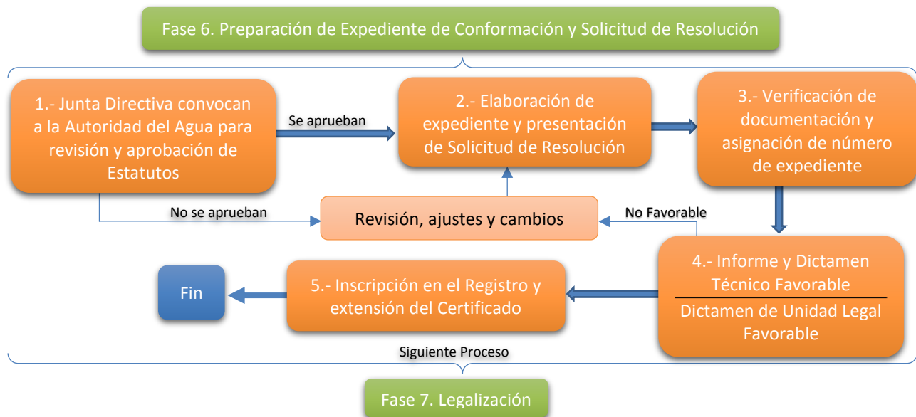
Esquema 6. Proceso para la Preparación de Expediente de Conformación y Solicitud de Resolución

A continuación en el Esquema 6, se presenta en forma gráfica el proceso que se requiere para desarrollar el expediente de conformación y el registro del Consejo.