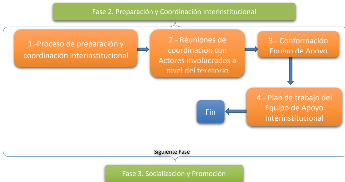
Esquema 3. Proceso de Preparación y Coordinación Interinstitucional

A continuación, en el Esquema 3, se presenta en forma gráfica el proceso a seguir en la Fase 2: