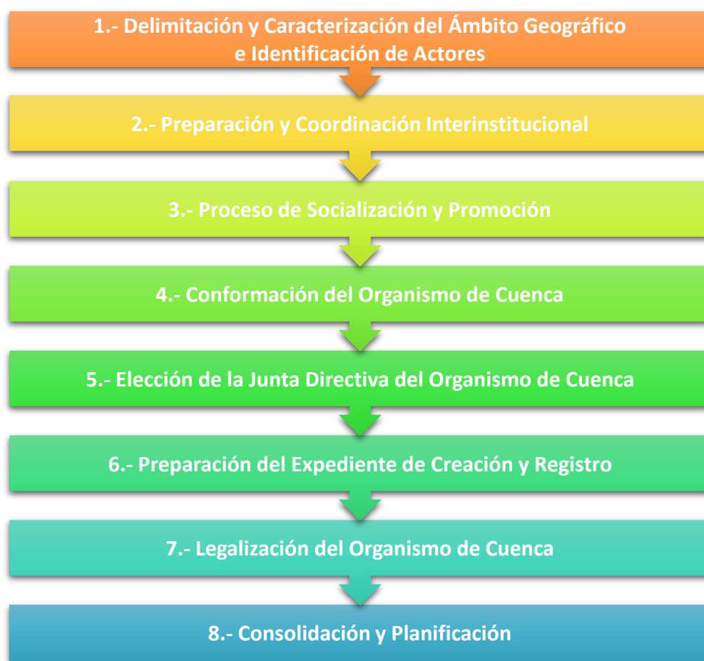
Esquema 1. Actividades del proceso para la Constitución y Legalización de Organismos de Cuencas

En ésta lógica, para el logro de un adecuado funcionamiento y desempeño de los Organismos de Cuencas, es pertinente que la conformación de los mismos surja como resultado de un proceso planificado; el cual debe incluir las siguientes etapas: