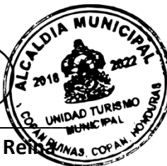
Ana Cecilia Casasola Remijn Unidad de Turismo Municipal

Tel: +504 2651-3900 E-mail: turismo@municipalidadcopanruinas.com Horario de atencion: de lunes a jueves de 7:30 AM a 12:00 M y de 1:30 PM a 5:00 PM Y viernes de 7:30 AM a 12:00 M y de 1:30 PM a 4:00 PM