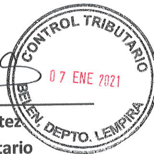
Melzary Cortez Control Tributario

Y para términos legales se extiende la presente constancia a los 07 días del mes de enero de año 2021.