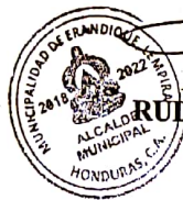
RUDY YADIR TREJO AMAYA Alcalde Municipal