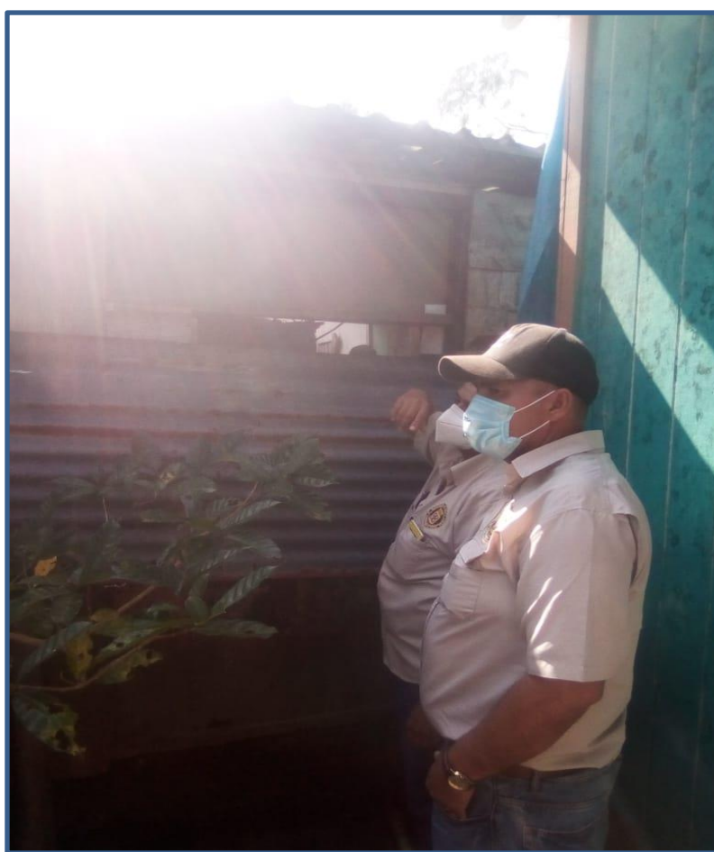
OPERATIVOS DE SEGURIDAD Y CONTROL DENTRO DEL MUNICIPIO