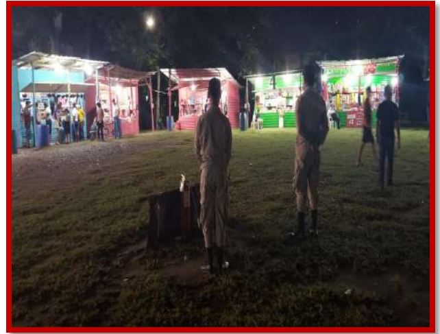
Inspección preventiva y seguridad en puestos temporales de venta de pólvora autorizado por la Municipalidad de Puerto Cortés.