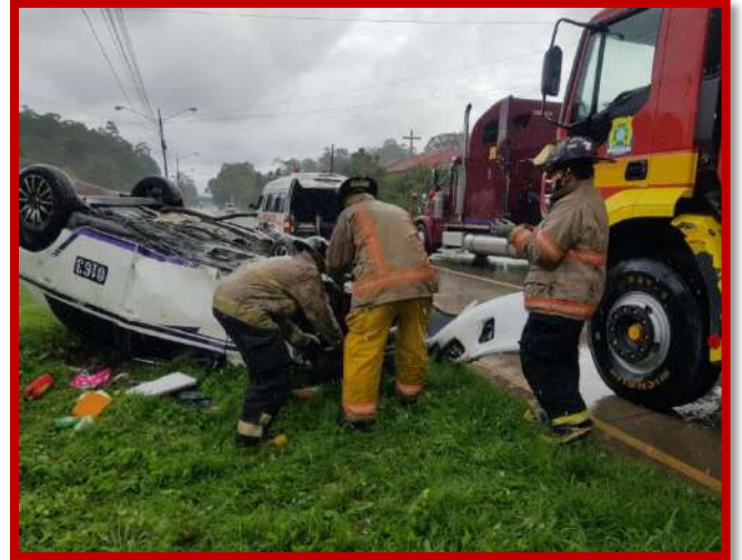
Respuesta de extricación y rescate de personas atrapadas en vehículo que sufrió accidente de tránsito.