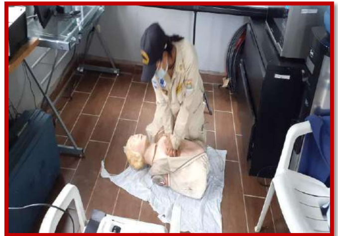
Capacitación en primeros auxilios a personal de empresa Almagran, Puerto Cortés.