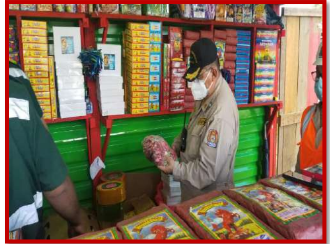
Participación en operativo de revisión de puestos de venta de pólvora autorizada en los predios municipales coordinado por el Departamento Municipal de Justicia.