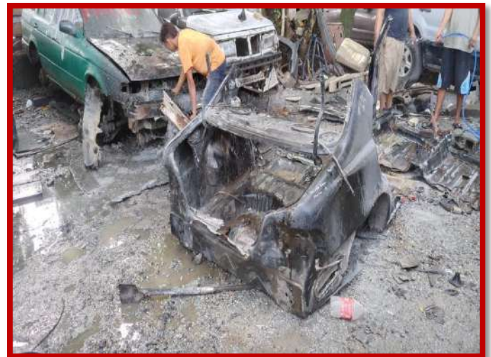
Inspección por reporte de incendio en restos de vehículo en el Yonker Joel, Barrio La Curva, 15 Calle, Puerto Cortés.