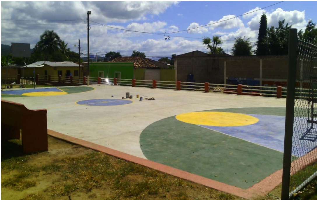
Marcado de cancha con pintura de alto tráfico.