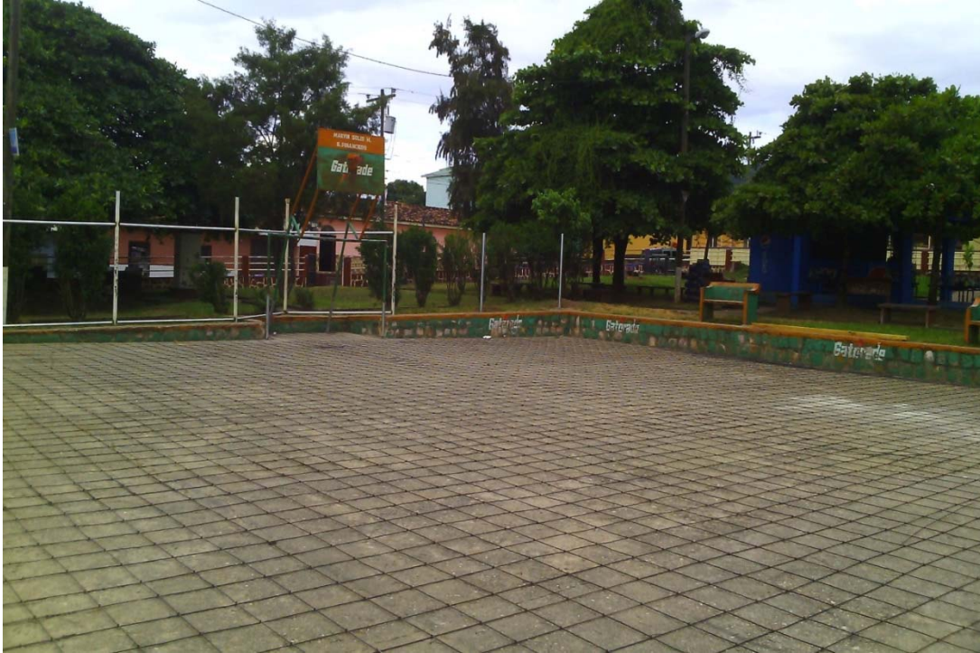
Colocación de hierro de temperatura y suministro e instalación de malla ciclón calibre #10