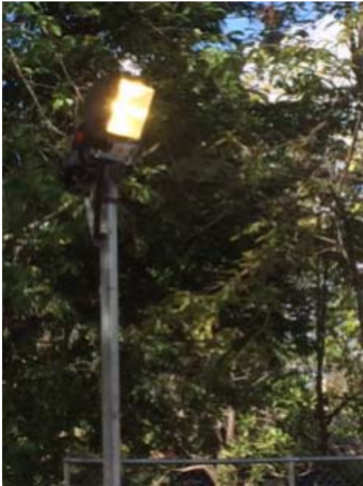
Alumbrado de la Cancha de Voleibol de playa