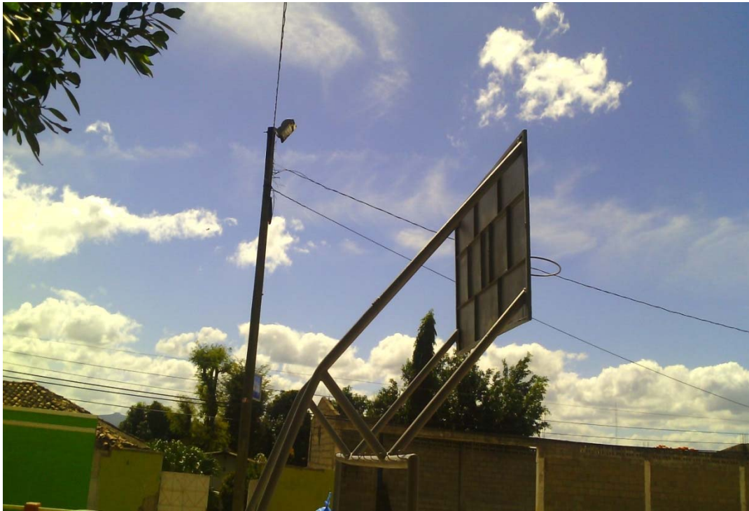
Suministro e instalación de reflector de 400 watts.