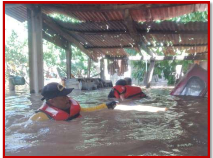
Rescate y evacuación de persona con problemas mentales en condición de riesgo.