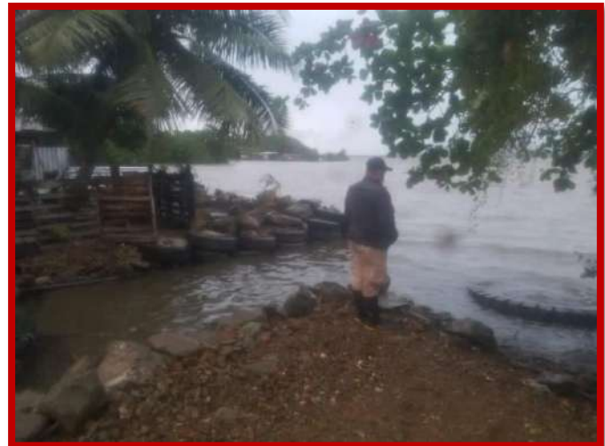
Inspección de los niveles de agua de La Laguna de Alvarado.