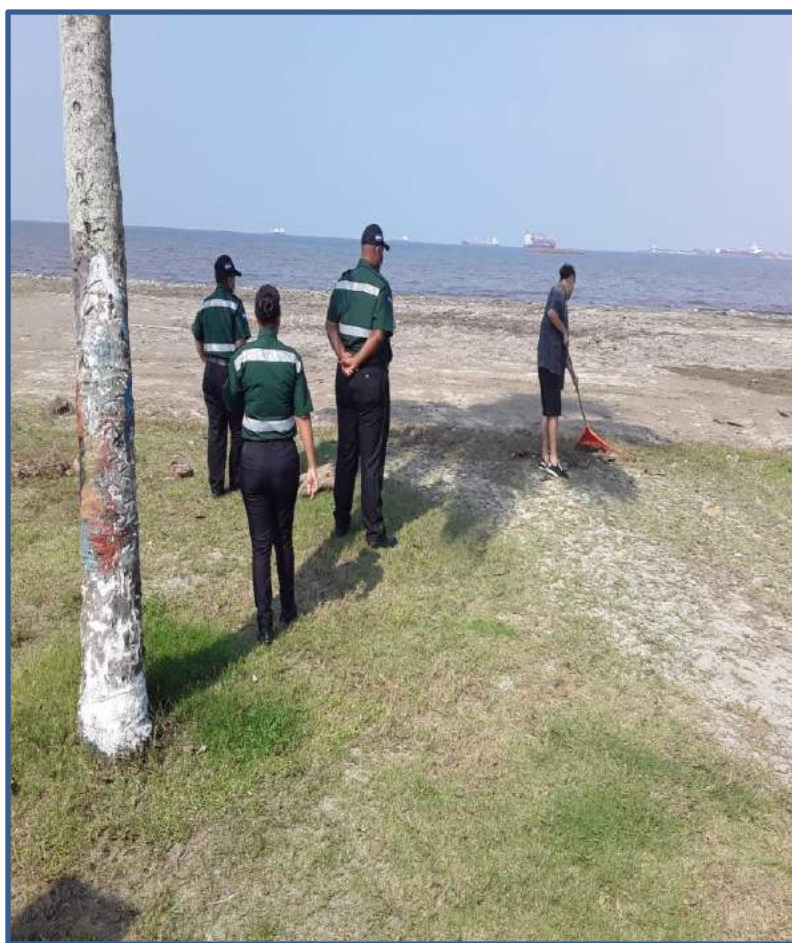
OPERATIVOS DE SEGURIDAD Y CONTROL DENTRO DEL MUNICIPIO