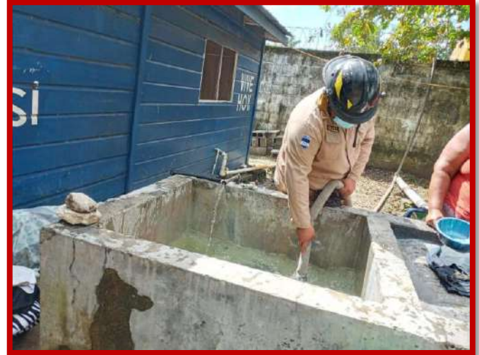
Dotación de agua a diferentes lugares de la ciudad.