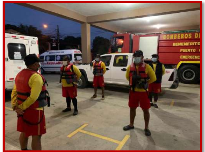
Preparación de equipo de rescate acuático y equipo de podas, formación del personal que va a misión de rescate y evacuación.