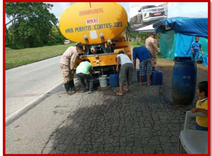
Dotación de agua a personas damnificadas a causa de tormentas ETA e IOTA.