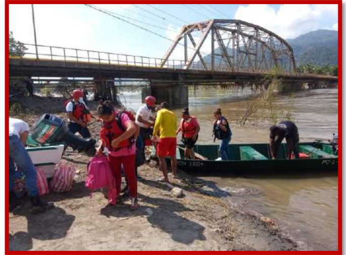
Evacuación y rescate de personas en sector de bajos de Baracoa.