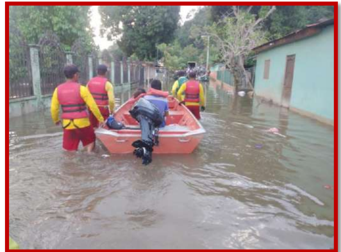
Evacuación y rescate de personas en sector de nuevos Horizontes y Bajos de Baracoa.