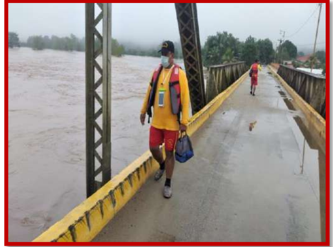
Monitoreo de los niveles de agua del rio Chamelecón y evaluación de puente.