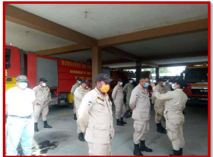
Atención de medios de comunicación locales para informar las múltiples actividades que presta la Estación de Bomberos Municipal de Puerto Cortés, control de toma de temperatura al personal.