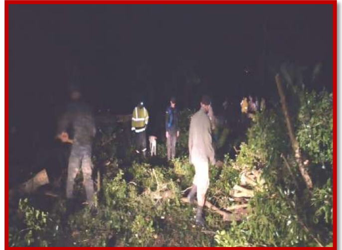
Corte y fragmentación de árbol caído sobre vía pública y dentro del crique.