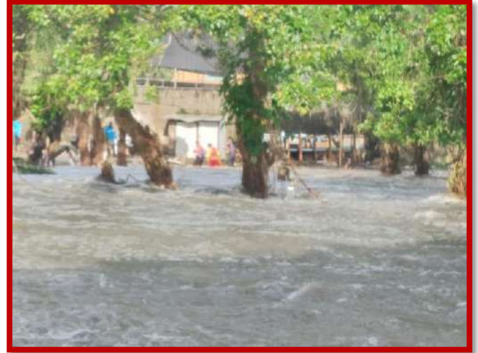
Evacuación y rescate de personas en sector de bajos de Baracoa.