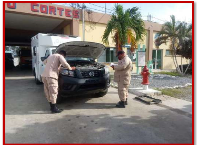
Revisión de unidades de emergencia por el personal de la compañía en servicio.