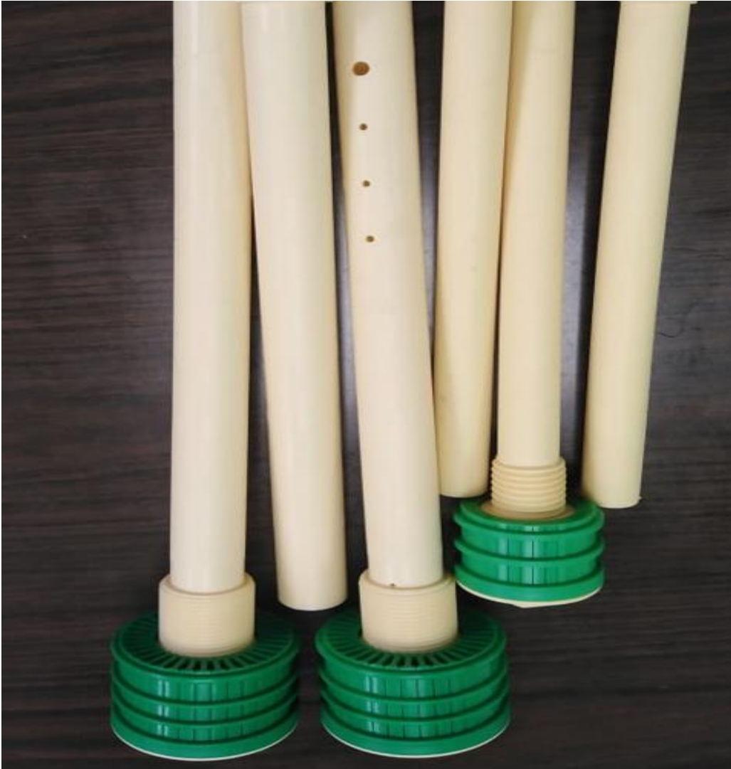
Imágenes ilustrativas para el tipo de presentación final.

NOTA: La no presentación de muestra será motivo de descalificación (NO SUBSANABLE).