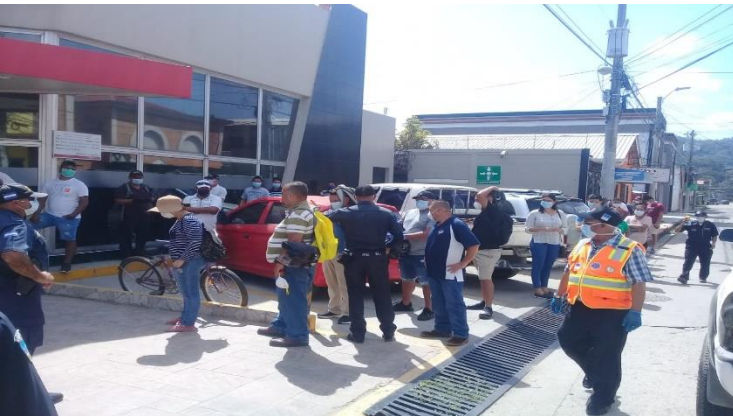
Patrullajes sugiriendo medidas de prevención contra el Covid-19