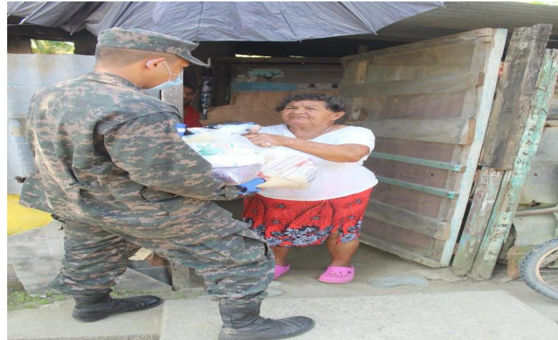
Veeduría entrega de ración alimenticia Honduras Solidaria