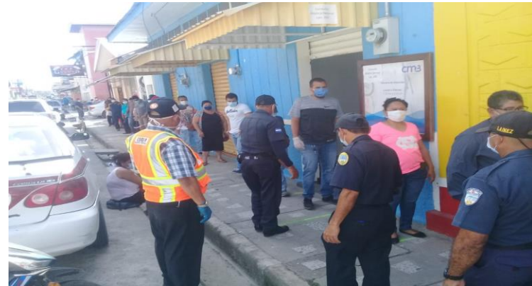
Distanciamiento social en los diferentes Bancos