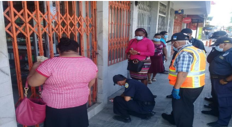
Pintado en aceras para distanciamiento contra COVID-19