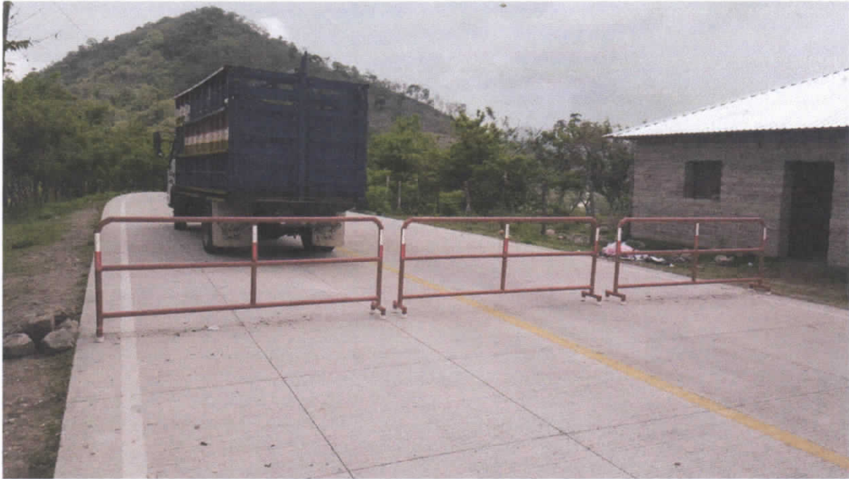
Barreras metálicas para retenes de control en la entrada y salida de personas al municipio , debido a la emergencia sanitaria COVID-19.