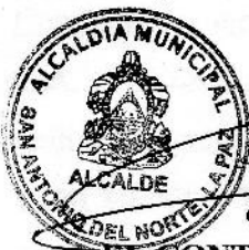
EL CONTRATANTE EULALIO MALDONADO ALCALDE

TERCERA: ACEPTACION. Las partes aceptan las anteriores estipulaciones y firman el presente contrato en el Municipio de San Antonio del Norte, La Paz, a los veinticuatro días del mes de julio del dos mil veinte.