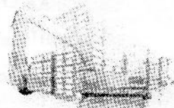
Constructora y Supervisora San Juan S. A. de C. V.