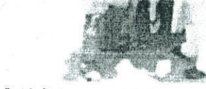
Pero se días internar, pero Orlando vivió la i

Como personas que he experimentado mi arte y mi vida en esta jornada, quiero decirle a la población que el COVID-19 existe, no es un juego. Si no van a ningún hospital, un caso más. Yo creí que