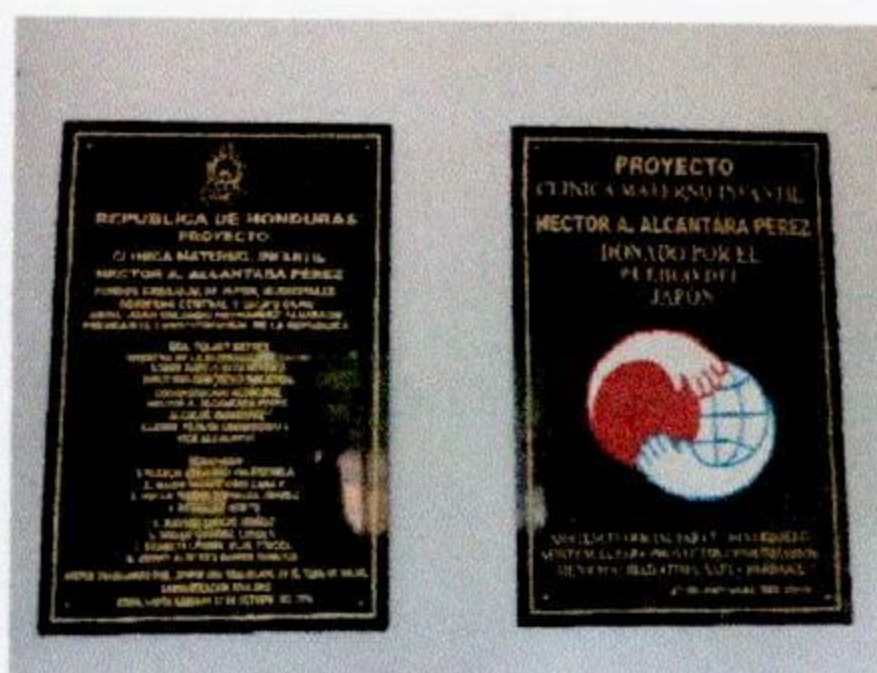
En el Materno Infantil de Atima