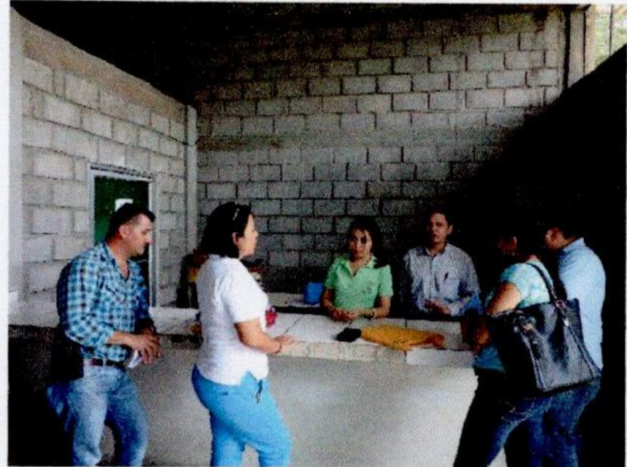
Conociendo las instalaciones del Hospital