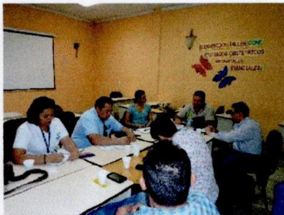
En reunión con el equipo de la Regional de Salud de Santa Bárbara.