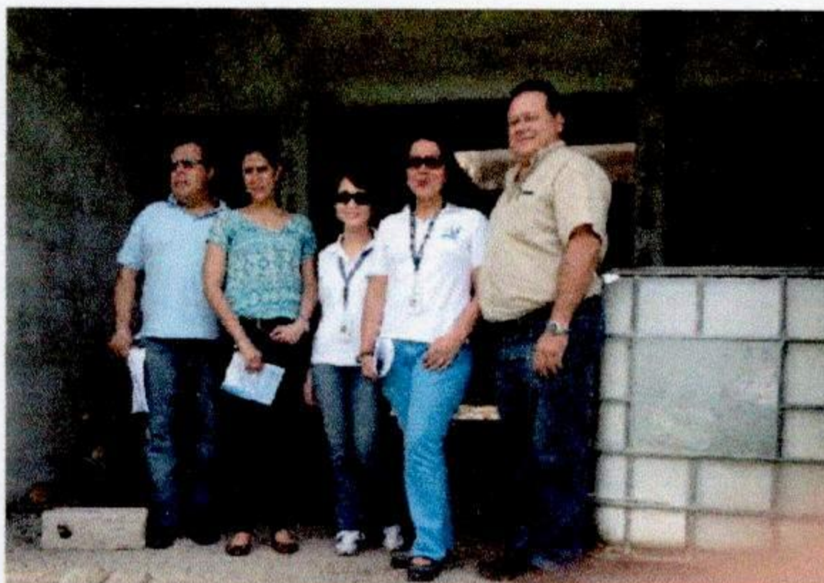
Construcción del edificio administrativo de la Regional de Salud.