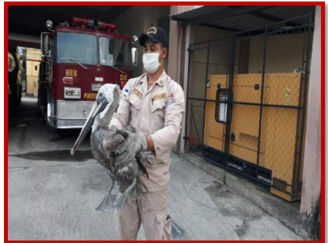
Apoyo a labor social en rescate de pelicano