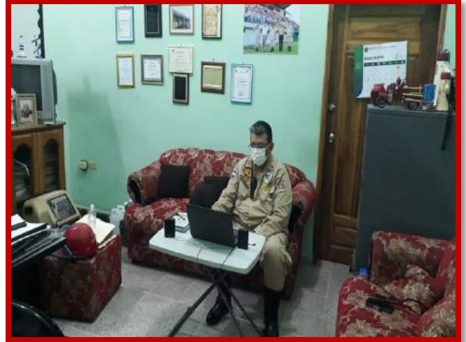
Participación en reunión del CODEM vía video conferencia