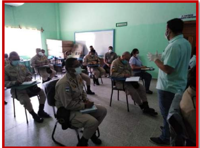
Capacitación en Primeros auxilios psicológicos impartido por miembros del Colegio de Psicólogos de Honduras.