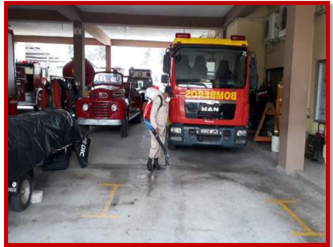
Fumigación y descontaminación de áreas comunes y de acceso de las instalaciones del Cuerpo de Bomberos Municipal de Puerto Cortés.