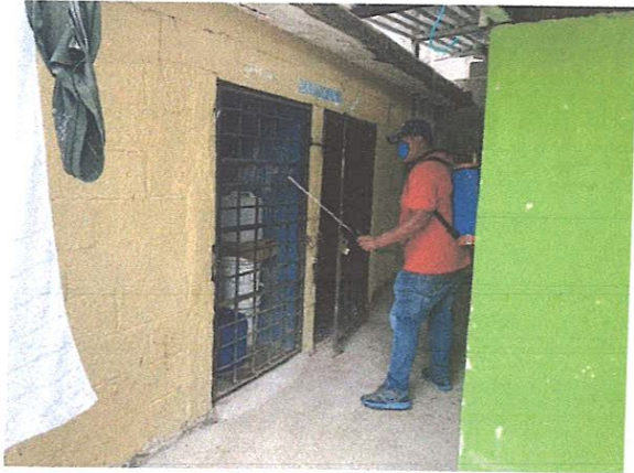
POSTA DE PIMIENTA

Semanal del lunes 27 de abril, al sábado 2 de mayo del 2020