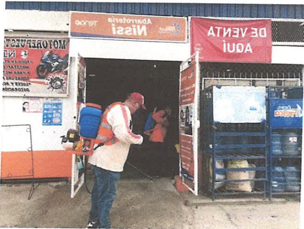
FUMIGACION DE PULPERIAS DEL PIMIENTA