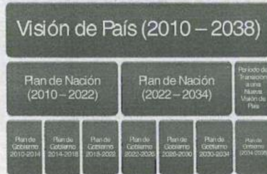
Diagrama 2: Relación Temporal de los Elementos del Sistema de Planación del Desarrollo

El Señor Presidente Electo de la República, Licenciado Porfirio Lobo Sosa, en el marco del proceso de diálogo y reconciliación nacional iniciado después del proceso electoral culminado el 29 de noviembre del año en curso, reiteró la necesidad que la Visión de País fuera materializada en un Plan de Nación, armónico e incluyente, basado en los esfuerzos realizados a partir del año 1998 y hasta el año 2009 inclusive, que como ya se ha mencionado, estuvieron basados en una serie exhaustiva de consultas con amplios sectores de la población hondureña.