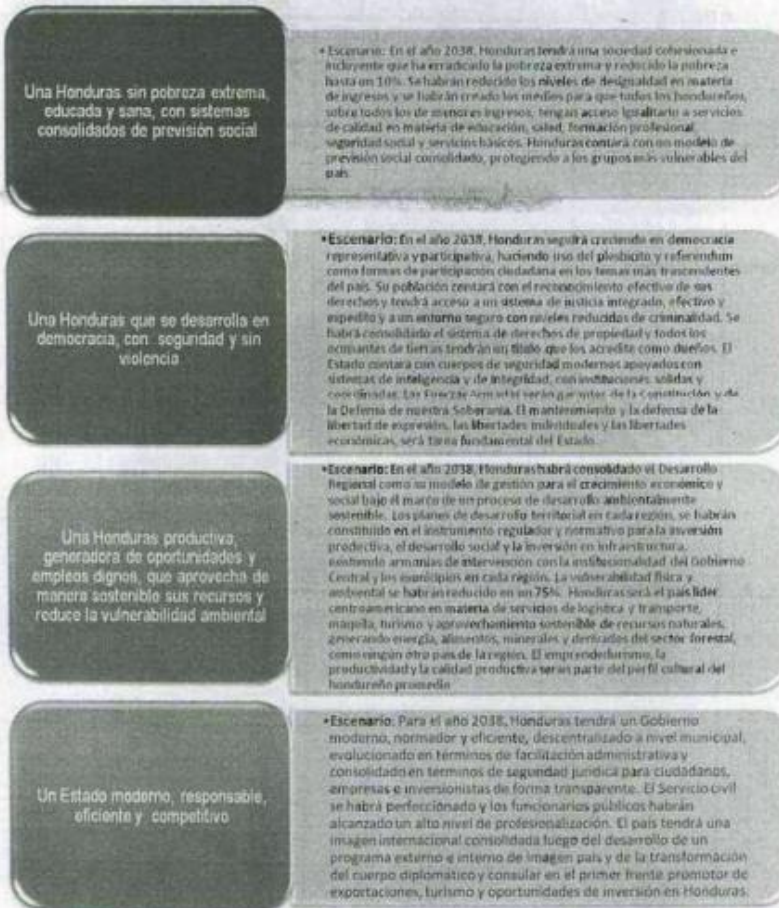
Diagrama 4: Descripción de los Objetivos de la Visión de País