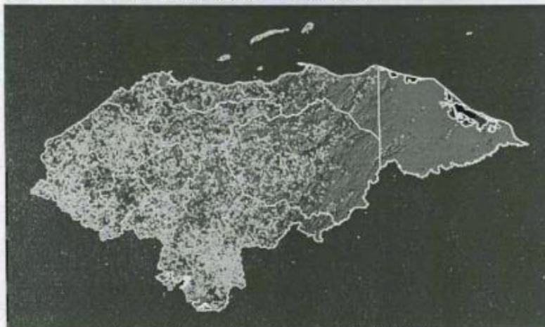
Puntos azules representan caseríos con menos de 50 habitantes