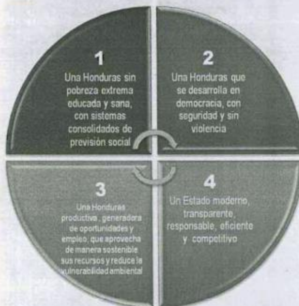
Diagrama 3: Objetivos Nacionales de la Visión de País

El diagrama siguiente enuncia el escenario esperado para cada objetivo nacional al año 2038: