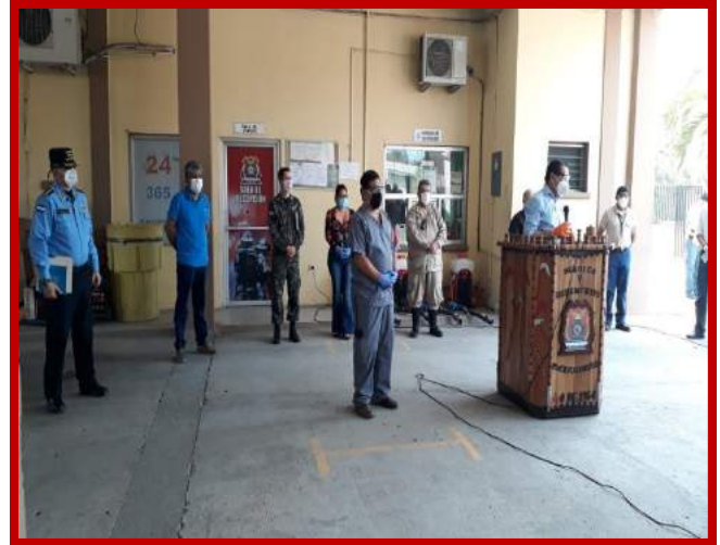
Reunión del Comité de Emergencia Municipal CODEM por emergencia COVID-19