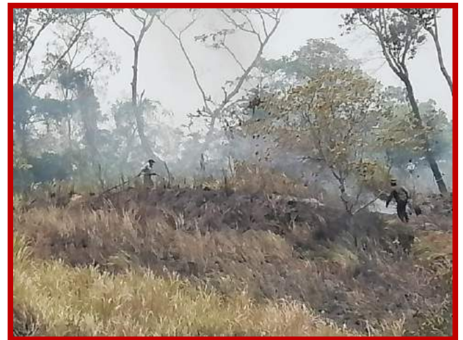
Control y extinción de incendio forestal en B° Cienaguita residencial vista mar