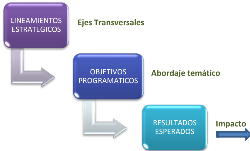
Cuadro no.1 Estructura analítica