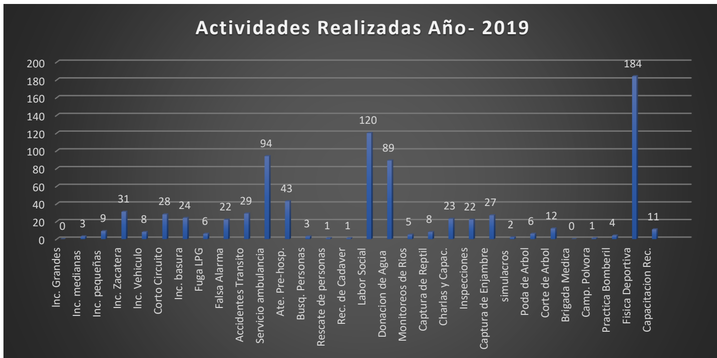
Gráfico de Emergencias Atendidas en el año 2019

En listado anterior se detalla algunas actividades que el cuerpo de Bomberos de Tocoa, realizó durante el año 2019, detallando cada una por mes, y al final el total por el año.