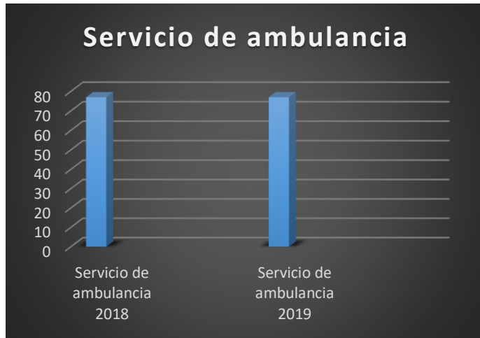
Grafico Comparativo de Servicios de Ambulancias 2018-2019

En el año 2018 la emergencia atendida en cuanto a servicios de ambulancia, fue inferior al año 2019