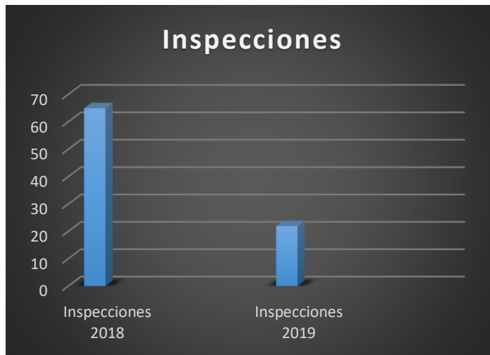
Grafico comparativo de Inspecciones Anual 2018-2019

El servicio de inspecciones realizadas a diferentes Instituciones privadas y públicos han disminuido para este año.