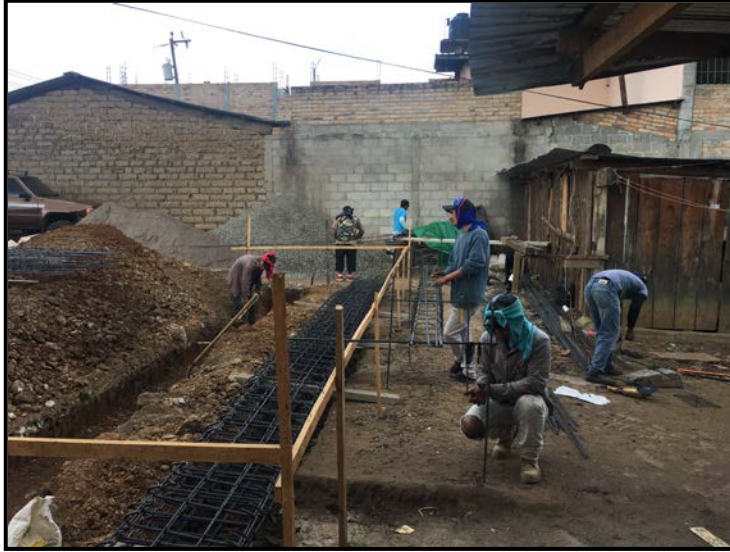
Actividad: Armado de Cimentación corrida y zapatas Fecha: 18/12/2019