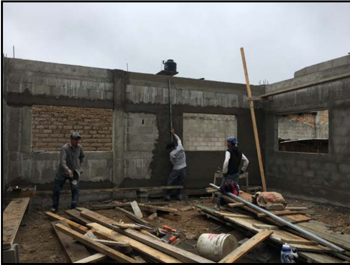
Actividad: Repellos de Paredes Fecha: 21/01/2020