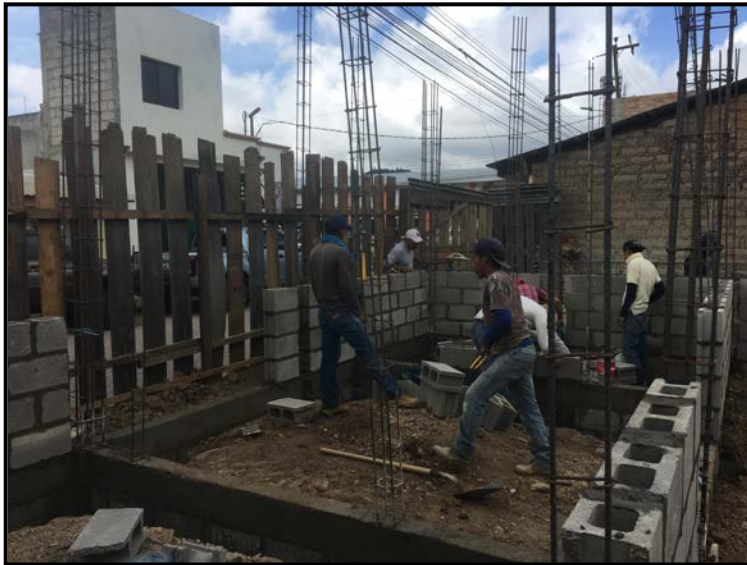
Actividad: levantado de Pared de Bloque 6" Fecha: 04/01/2020