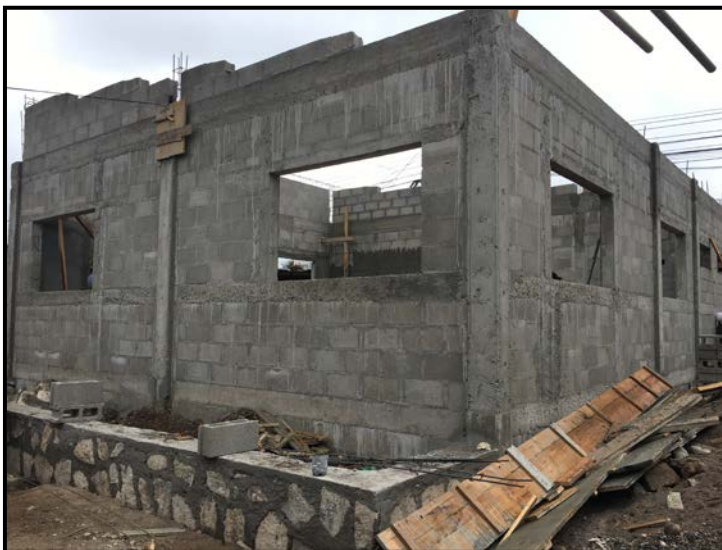
Actividad: Muros y columnas hasta nivel de Viga V-1 corona y muro de piedra posterior. Fecha: 21/01/2020