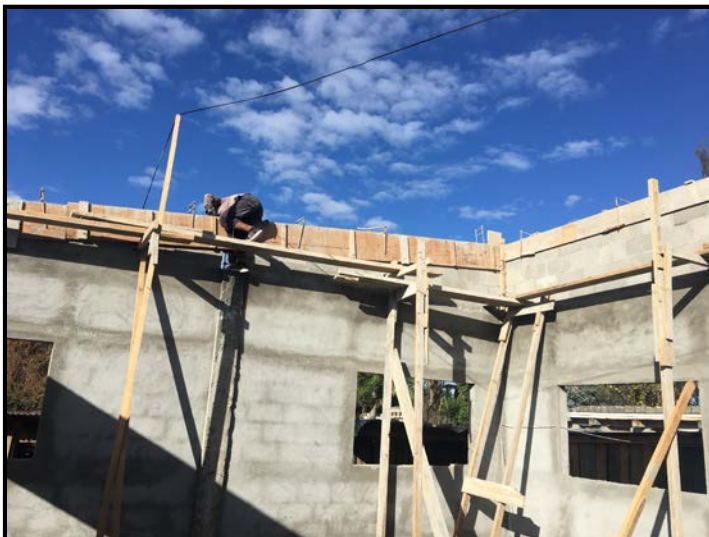
Actividad: Encofrado y armado de Hierro solera cierre de culatas, y repellos internos Fecha: 22/01/2020