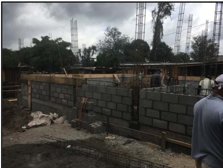
Actividad: levantado de Pared de Bloque 6" y armado y encontrado de Solera intermedia Fecha: 04/01/2020