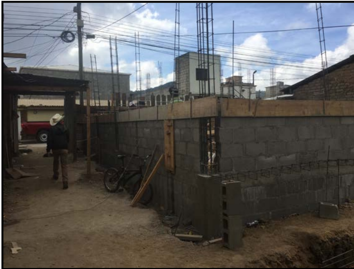
Actividad: armado y encontrado de Solera intermedia Fecha: 04/01/2020