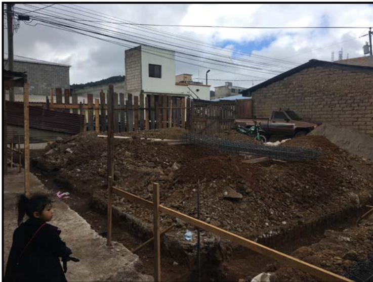
Actividad: Excavación de Cimentación Fecha: 18/12/2019