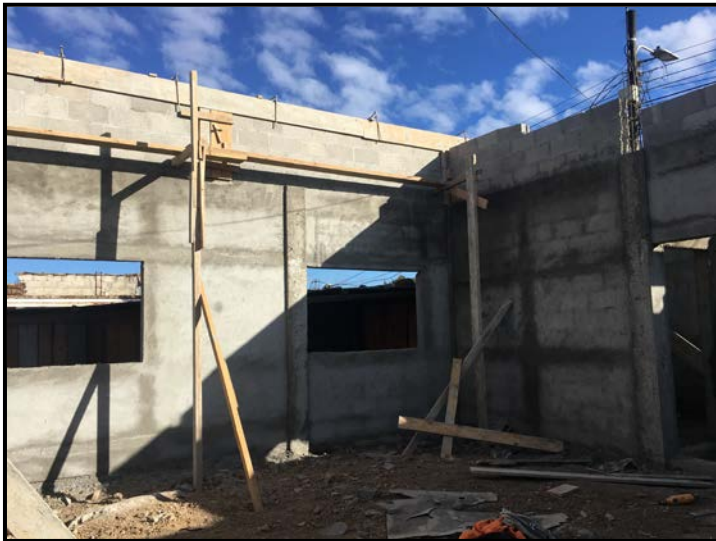
Actividad: Encofrado y armado de Hierro solera cierre de culatas, y repellos internos Fecha: 22/01/2020