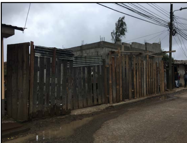
Actividad: Muros y columnas hasta nivel de Viga V-1 corona y muro de piedra posterior. Fecha: 21/01/2020