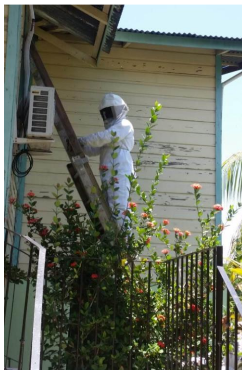
Control de abejas