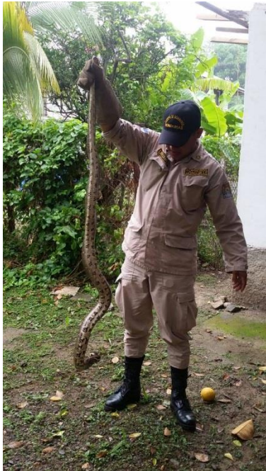
Rescate de animales