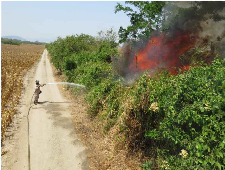
Quemas de zacateras