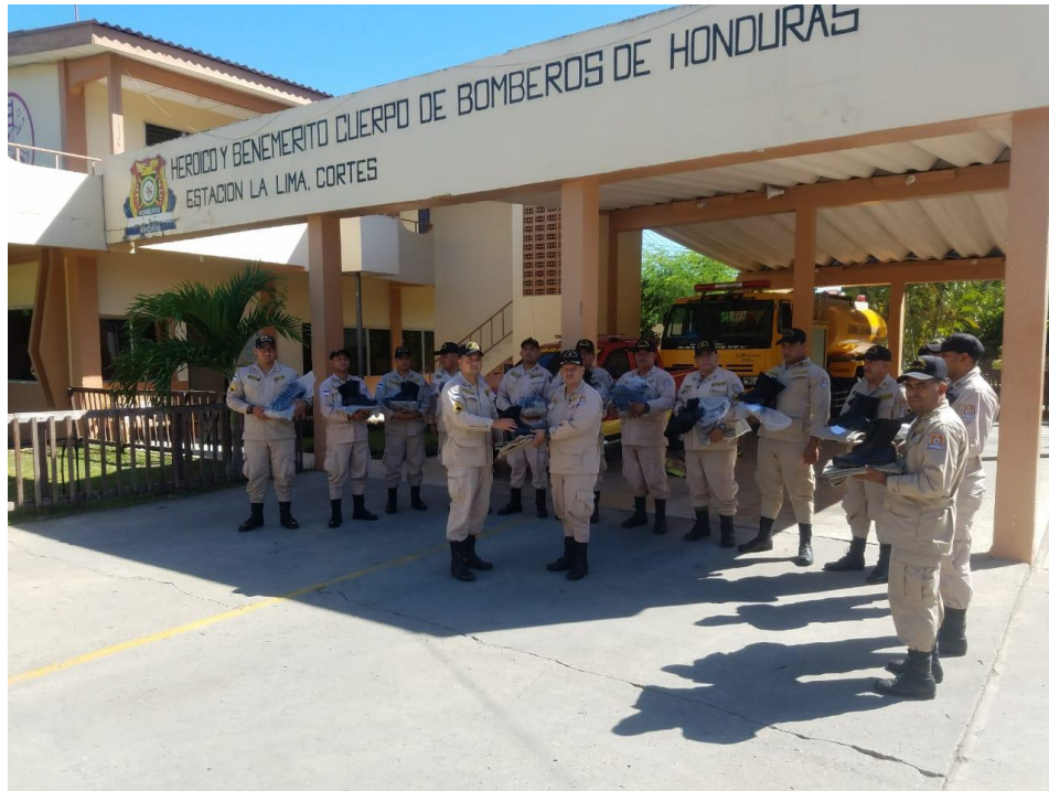
Entrega de uniformes al personal