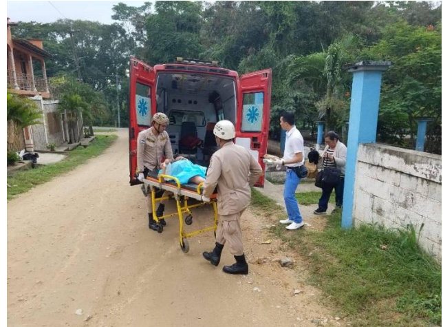
Accidentes de tránsito y servicios de ambulancia