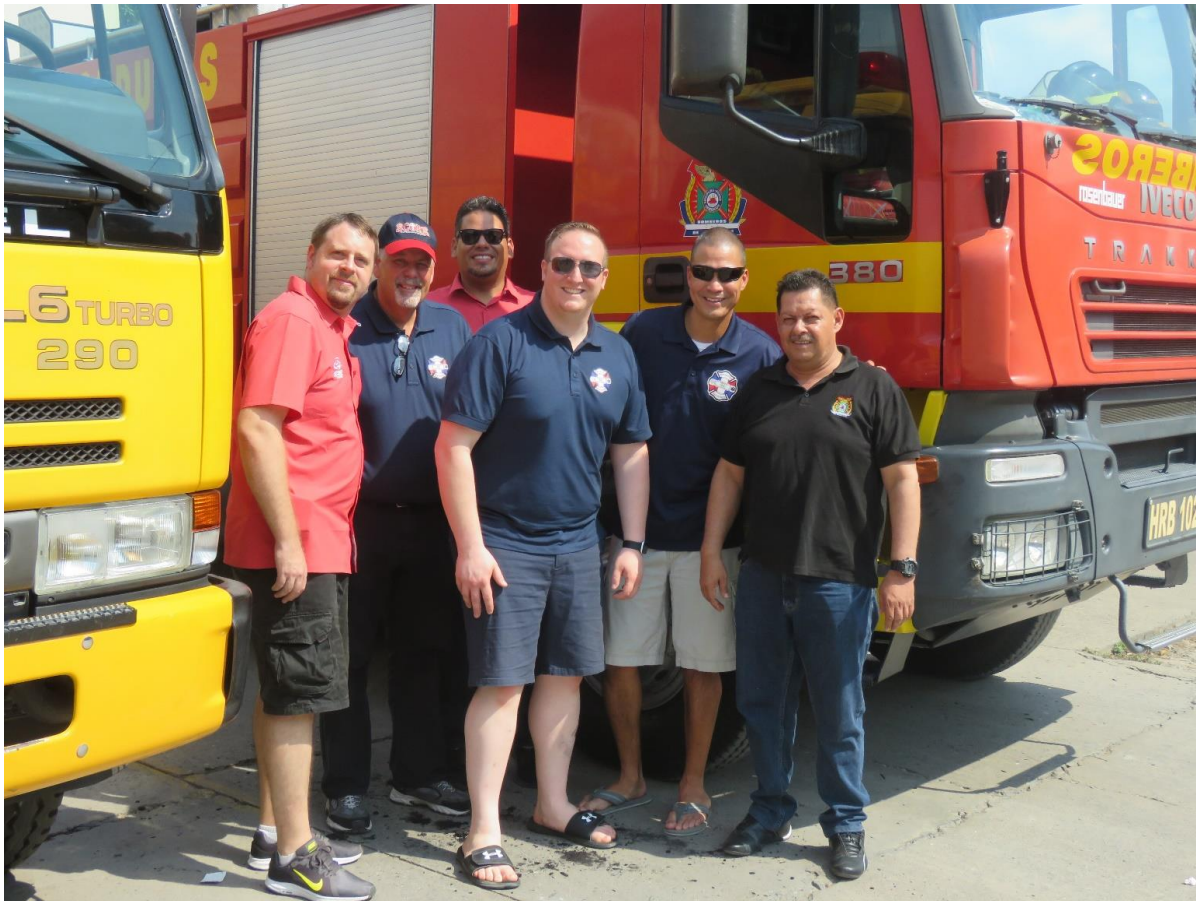
Celebración día del niño por parte de SCORE INTERNATIONAL en La Estación Local de la Lima