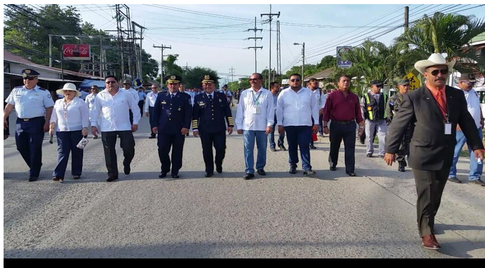
Desfile 15 de septiembre