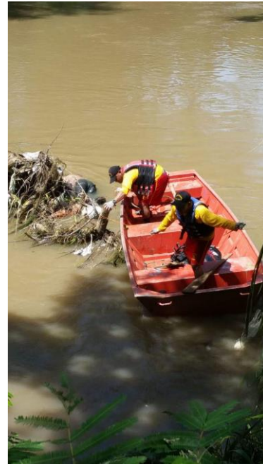
Recuperacion de cadaveres