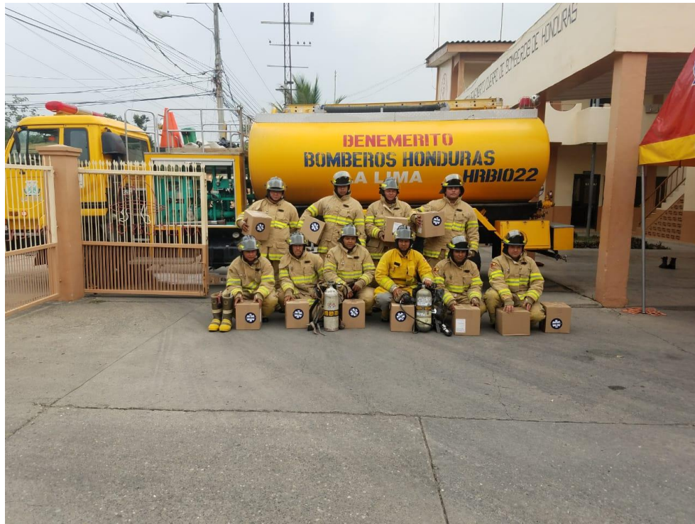
Donación de equipo de protección contra incendio