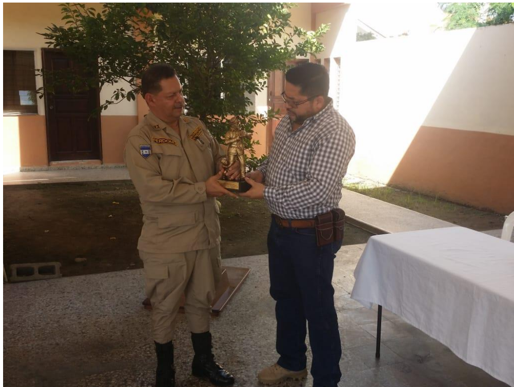
Entrega de reconocimiento al Señor alcalde Por buena relación y gestión por los fondos tasa