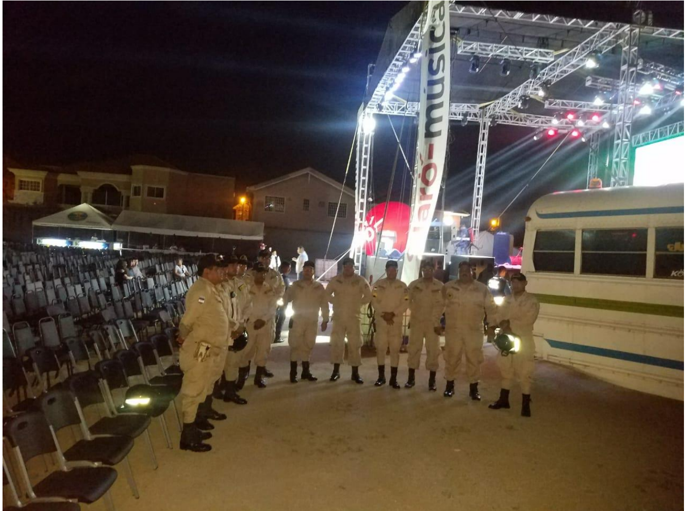
Brindando protección en concierto internación en la Feria agostina La Lima Cortes