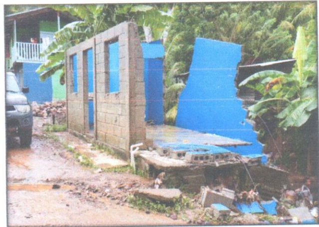
Entrega de ayuda humanitaria, afectados por frente frío # 24