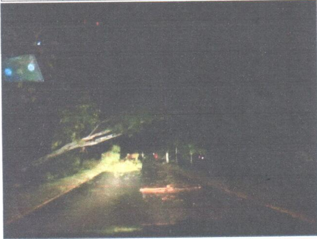
Ingreso de frente frío #24