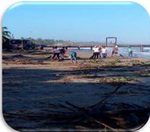
Limpieza de Playas Municipales