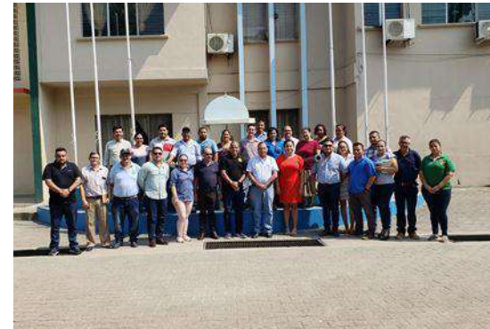
Capacitación Sobre Portal Único de Transparencia, Tela