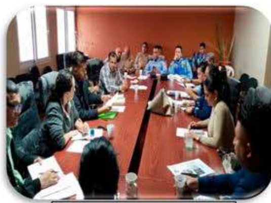
Reunión Virgen de Suyapa