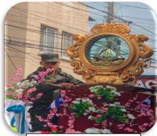
Visita de la Virgen de Suyapa