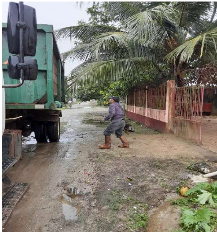
Ilustracion4. Recolección de desechos sólidos en Sector Mezapa.