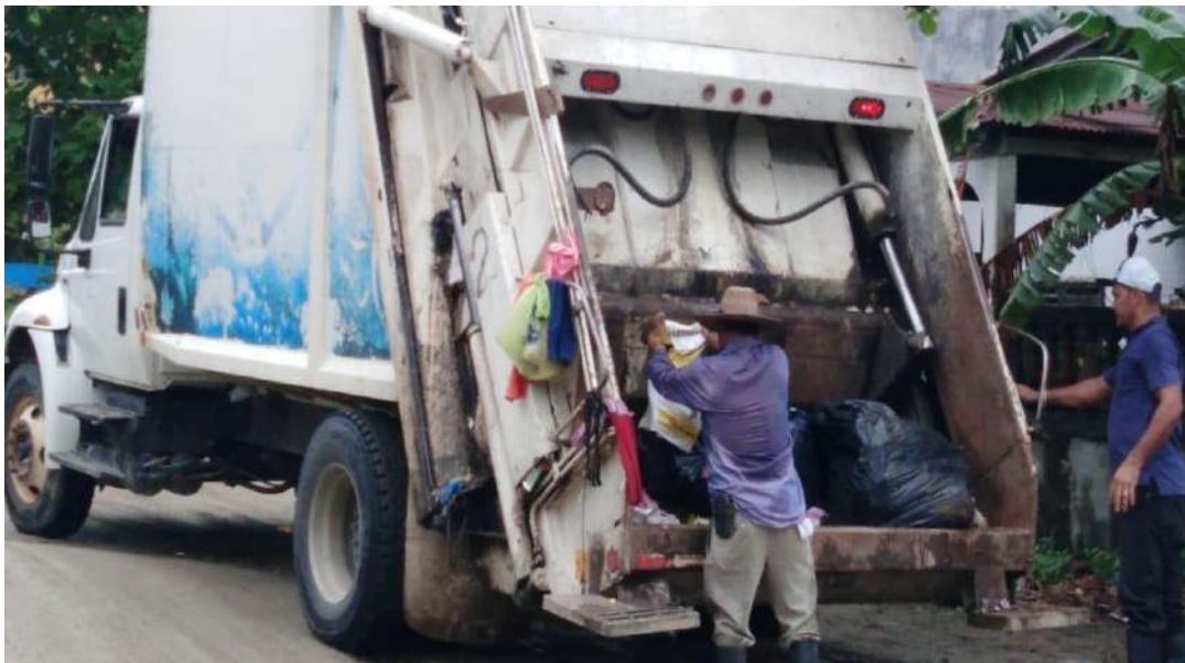
Ilustracion2. Recolección de desechos sólidos en Barrio Lempira.