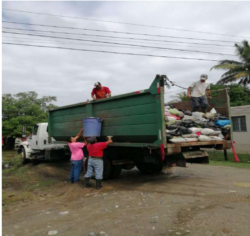
Ilustracion1. Recolección de desechos sólidos en Barrio Las Lomas.