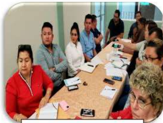
Reunión Cámara de Comercio