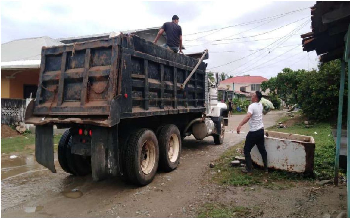
Ilustracion3. Recolección de desechos sólidos en la Col. Beatriz Thibou