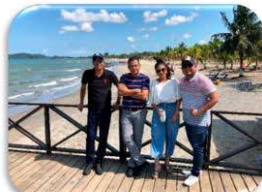
Cobros de baños, palapas y parqueo