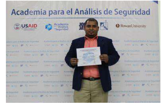
Diplomado en Seguridad y Políticas Públicas, El Salvador