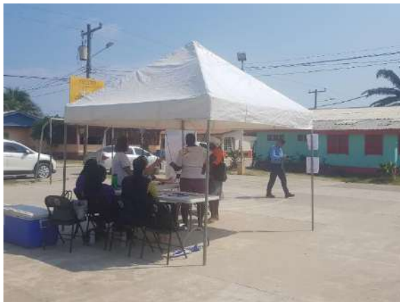
-Feria de Atención Psicológica y Legal