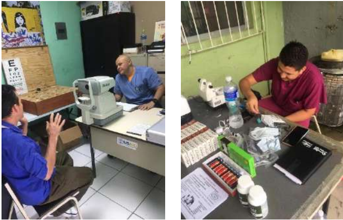
-Brigada Oftalmológica Visión Global