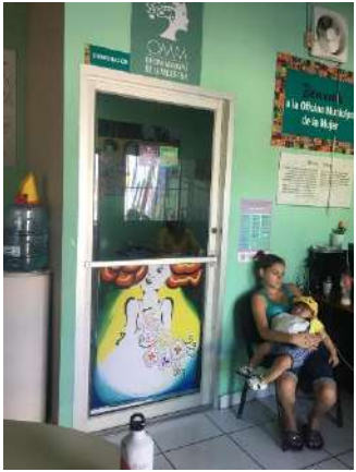
- Atención Psicológica y Legal.