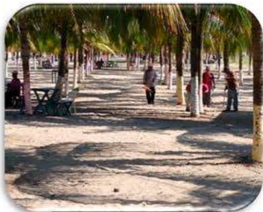
Inspección sector Muelle