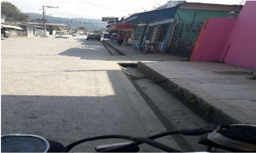
Causas de la ciudad limpias libre de azolvamiento y basura