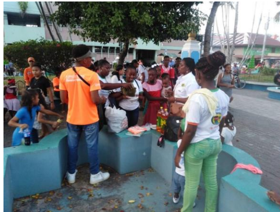
Navidad con propósito, celebrada el día viernes 13 de diciembre de 2019