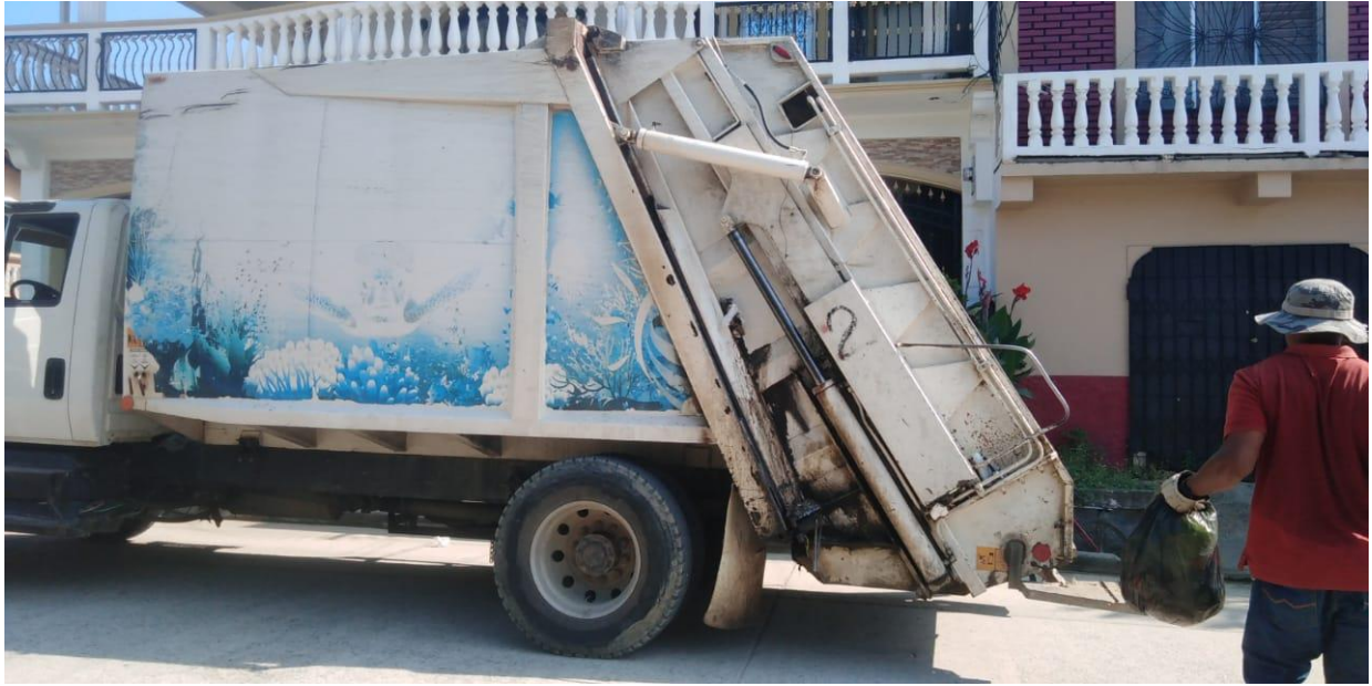
Ilustracion1. Recolección de desechos sólidos en Barrio El Way.