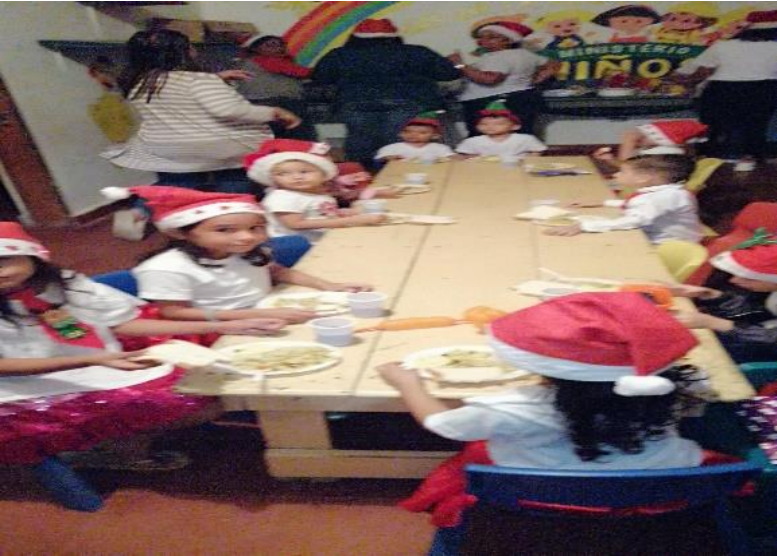
ACTIVIDAD CENA NAVIDEÑA