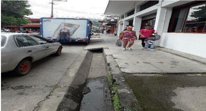
Supervisión de cauces