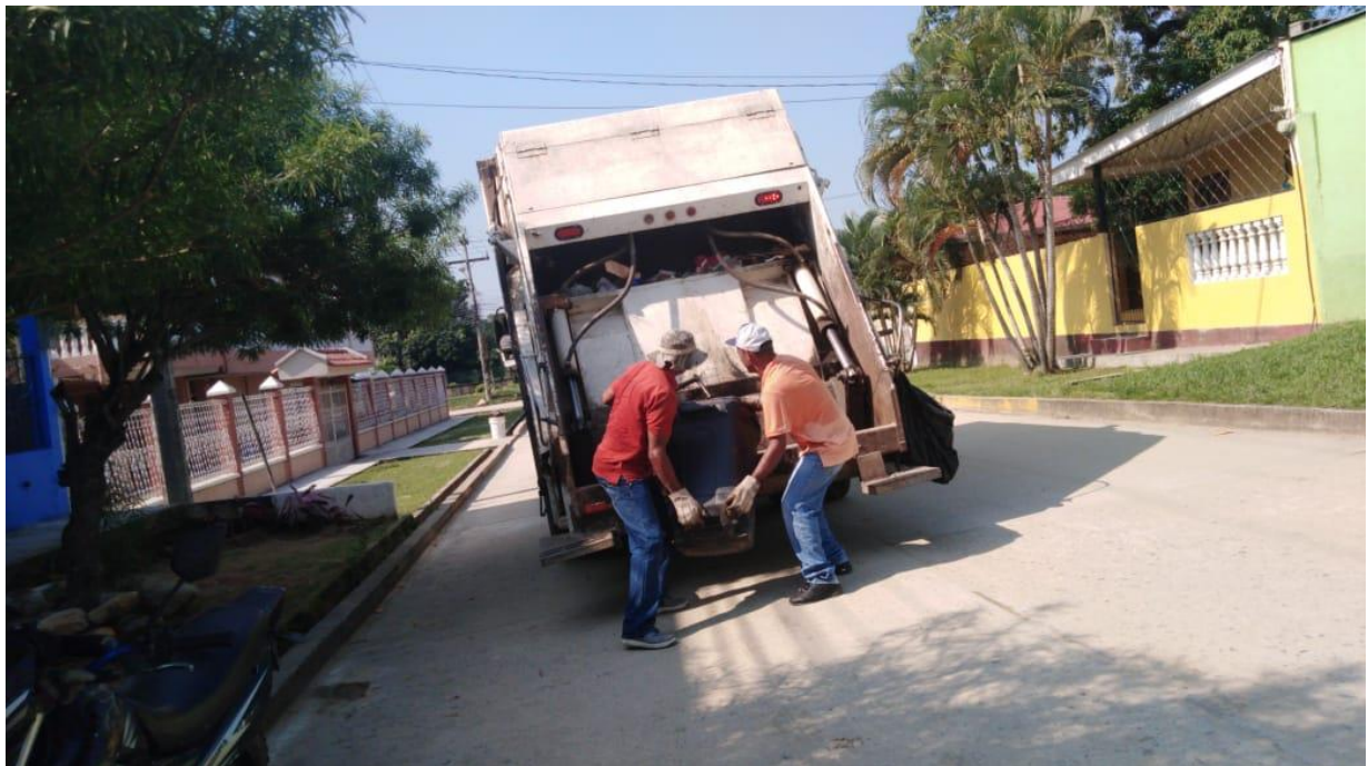
Ilustracion2. Recolección de desechos sólidos en Barrio Buenos Aires.