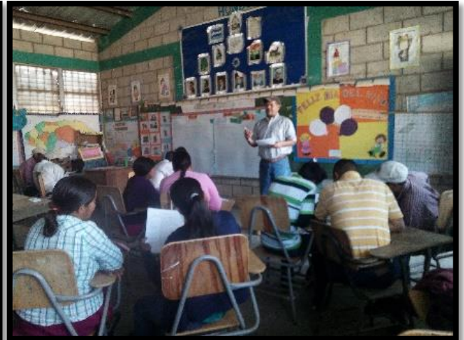
P.D.C. Lepaterique Norte, San