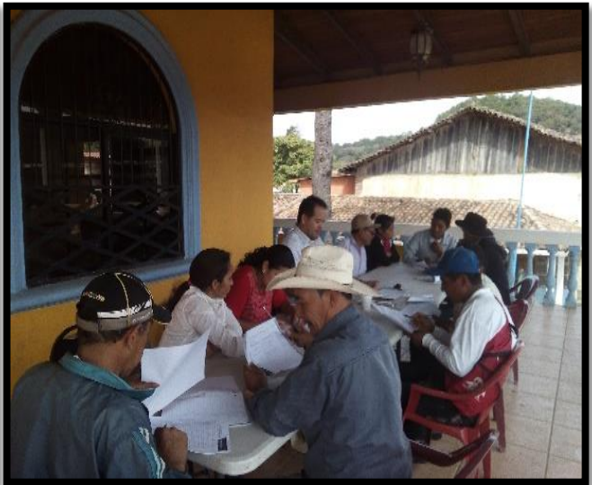
Elaboración de Plan Zonal sector: 3 Sector: