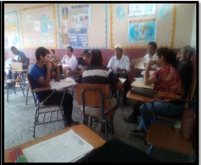
P.D.C. Chogola Centro, San Vicente N-E