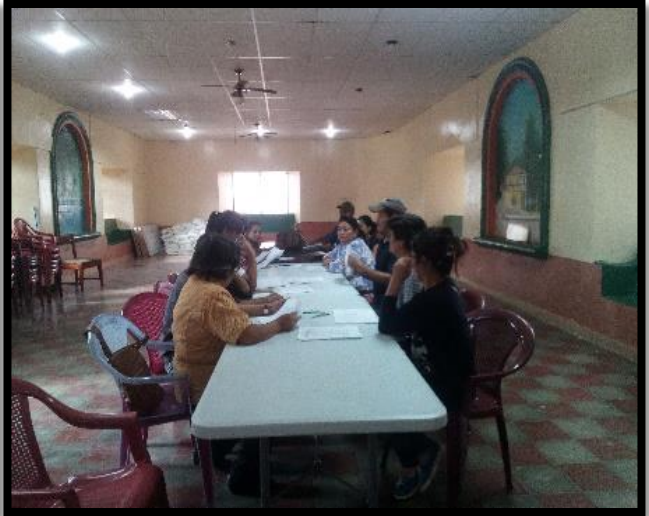
Elaboración Plan Zonal Sector: 2