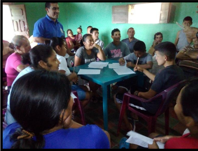
Elaboración de Plan Zonal Sector: 1 - N-