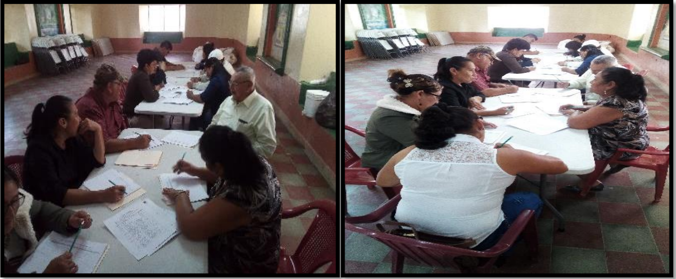
Revisión de P.E.D.M