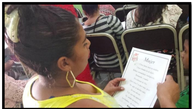
FORO DIA DE LA MUJER.