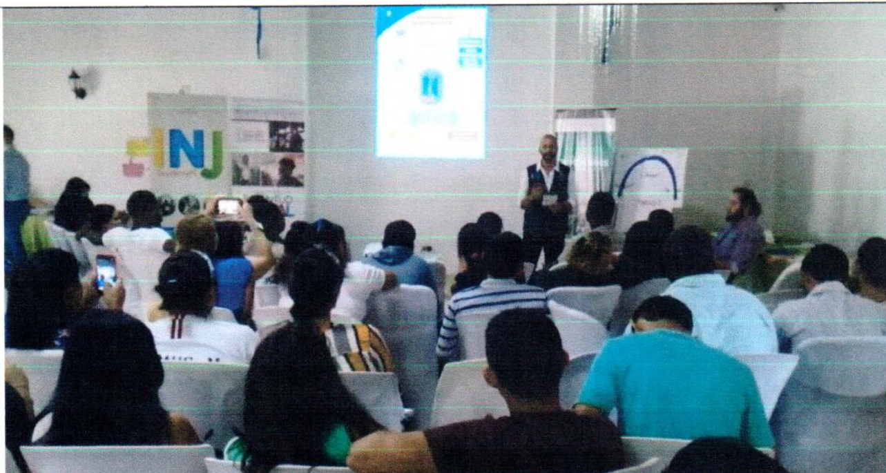
FOTO # 3

Actividad: Encuentro Nacional de Juventudes Rurales // Socialización de la LMDIJ y Guía Metodologica de los Smj.