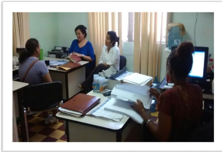
Fotografía: Atención a usuarias UDM

La Unidad de Desarrollo de la Mujer se estructura como tal en febrero de 2005.