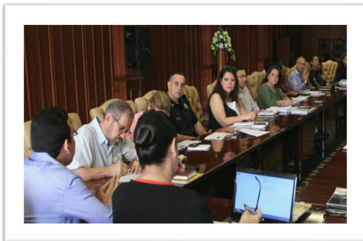
Fotografía: Reunión interinstitucional

A nivel municipal, la Unidad de Desarrollo de la Mujer establece coordinaciones para la atención de las usuarias a través de la Vice alcaldía municipal, con el departamento municipal de la niñez para la remisión de casos relacionados a la defensoría de la niñez; Programa de Asesoría Económica (PAMA), para la asesoría microempresarial y capital semilla; la Unidad de Salud de la Municipalidad, brinda servicios en salud, brigadas médicas odontológicas, brindan atención a la Casa Hogar Lucecitas, SI Transporte y Seguridad, la oficina de Estadística para el manejo de información sobre la violencia contra las mujeres, Transporte y seguridad apoyan al personal de la OMM, entre otras. En el nivel nacional, la Unidad debe coordinar con el Instituto Nacional de la Mujer, así como con instituciones del sector salud, educación, justicia y Ministerio Público, entre otras. Acuerpará también su gestión en las organizaciones de sociedad civil, con especial énfasis en organizaciones y redes de mujeres presentes en el municipio. Finalmente, se apoyará en organismos y agencias de cooperación internacional.