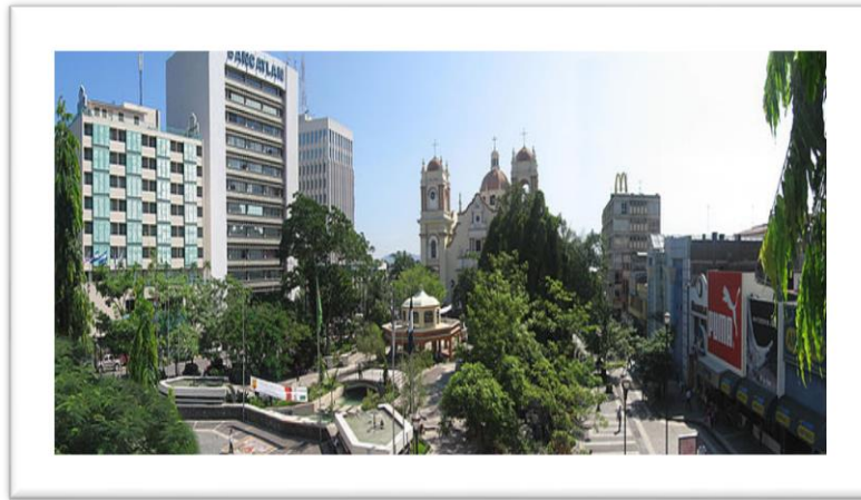
Fotografía: Imagen del centro de la Ciudad de San Pedro Sula

La Unidad de Desarrollo de la Mujer fue creada, con la participación y el apoyo de la Sociedad Civil, Grupos de Mujeres Organizadas, autoridades municipales y el apoyo técnico del Instituto Nacional de la Mujer.