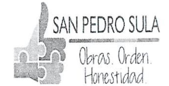
TABLA DE BIENES INMUEBLES DE LA MUNICIPALIDAD DE SPS