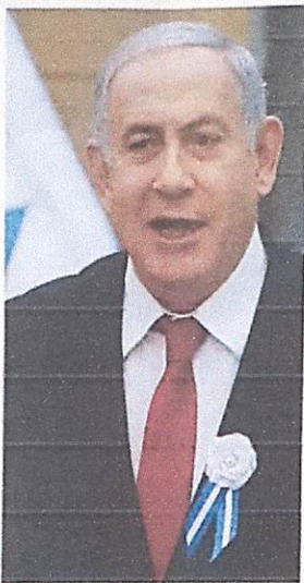
Benjamin Netanyahu, primer ministro israelí.

rentes, acusaciones que él califica de "caza de brujas". El fiscal Avichai Mandelblit decidirá si se imputa o no al primer ministro por corrupción, fraude y abuso de confianza en uno o varios de los casos, identificados con códigos de cuatro cifras. En el "expediente 1,000", se acusa a Netanyahu de haber recibido más de 700,000 séqueles (unos 185,000 euros) de regalos de parte de riquísimas personalidades, en especial del productor australiano James Packer, a cambio de favores financieros o personales. AFP