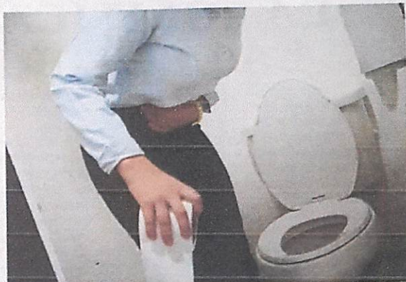
Seguido de la enfermedad del dengue, la diarrea es la segunda causa de atenciones en los centros asistenciales.

El tema es el de la morbilidad infantil, es decir niños que se enferman por diarrea y alimentos contaminados, la que hay que combatirla, expresó.