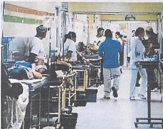
Las autoridades del Hospital reportaron que los más afectados fueron hombres y niños por accidentes de tránsito.

“El sábado los más afectados eran niños, se atendieron unos 13”, afirmó la directora.