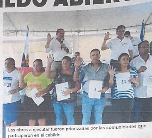
Las obras a ejecutar fueron priorizadas por las comunidades que participaron en el cabildo.

Entre los proyectos solicitados y aprobados están: la construcción de puente peatonal que servirá para unir Chameleconico, con otros sectores. Por su parte el sector de Campana pidió el levantamiento de una calle y construcción de cunetas, las demás comunidades solicitaron la construcción de un escenario, crear tendido eléctrico y un transformador, entre otras necesidades que tienen los pobladores de este municipio.