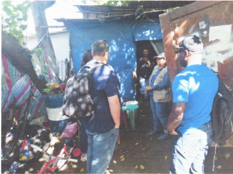
Fotografía IIIII " Donantes de Food for the poor en la ribera Bordo Río Blanco"