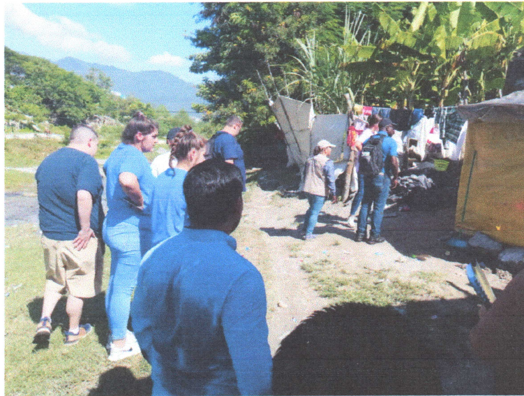
Fotografía III " Donantes de Food for the poor en la ribera Bordo Río Blanco"

Handwritten signature or mark in a circle.