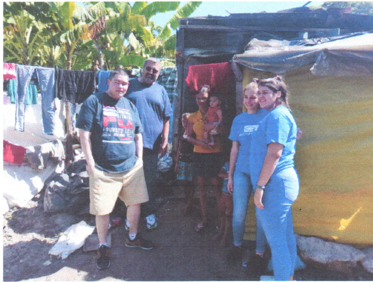
Fotografía I " Donantes de Food for the poor en el Bordo Río Blanco"