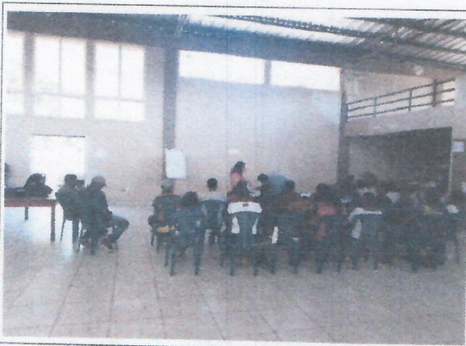
Municipio de Juticalpa Departamento de Olancho (Imagen 4)