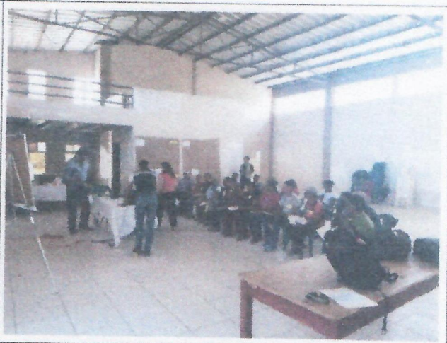
Municipio de Juticalpa Departamento de Olancho (Imagen 4.1)