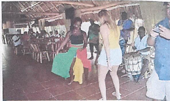
Miles de compatriotas y turistas internacionales podrán disfrutar de las maravillas que ofrece nuestro hermoso país.

San Antonio de Oriente, Tatumbla, Villa de San Juancito y Yucarán). Estos productos turísticos están destinados a deleitar a viajeros y turistas en estas vacaciones ya que todo el que recorre nuestras tierras puede apre-