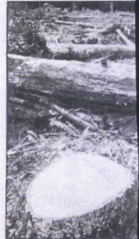
Las autoridades ambientales de Panamá suspendieron el otorgamiento de permisos y concesiones forestales en un esfuerzo por combatir la tala ilegal de árboles.

PANAMÁ (AP). - Las autoridades ambientales de Panamá suspendieron por un año el otorgamiento de permisos y concesiones forestales en un esfuerzo por combatir la tala ilegal de árboles.