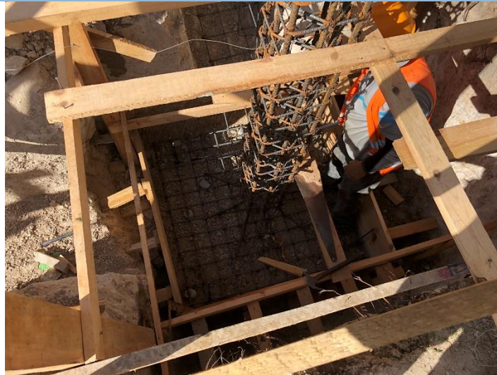
Imagen 3. Armado de Zapatas Aisladas