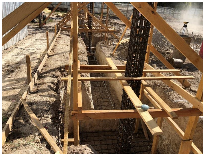
Imagen 3. Armado de Zapatas Corridas y Aisladas

Una vez concluidas las excavaciones, comenzó la actividad de fundición de zapatas aisladas y corridas.