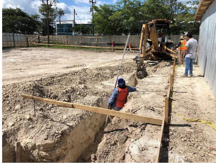
Imagen 1. Excavación de Zapatas Corridas