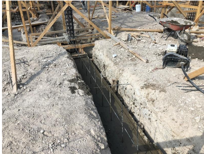
Imagen 4. Fundición de Zapatas Corridas