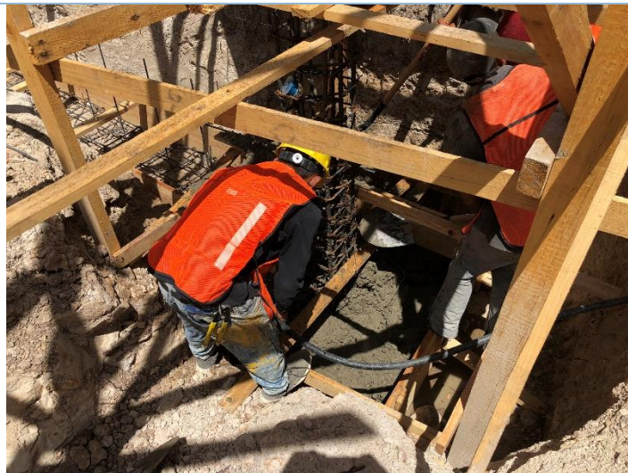
Imagen 3. Fundición de Zapatas Aisladas