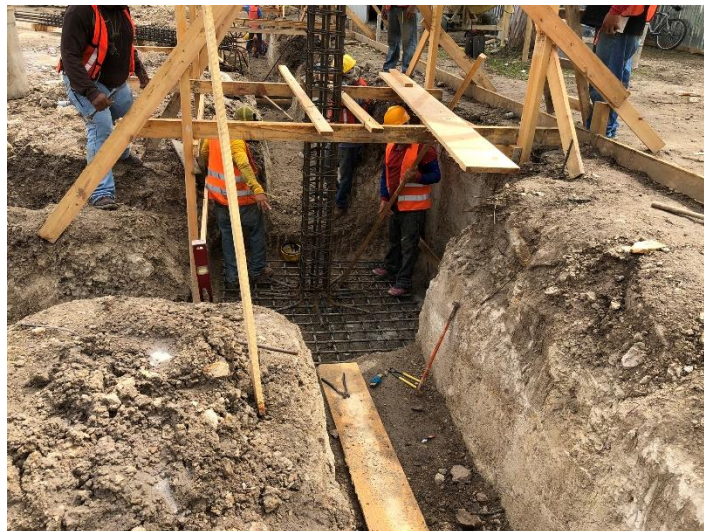
Imagen 5. Armado de Columnas.

Una vez concluidas las excavaciones y armado de parrillas de zapatas se procedió al armado y colocación de las columnas C-1. Una vez en su puesto se hizo de nuevo la verificación que la distancia entre ejes fuera la correcta según especificaciones contractuales.