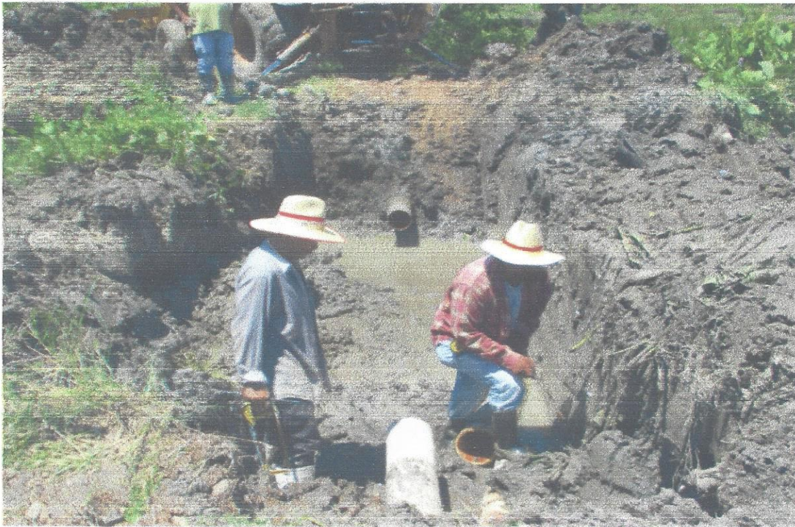
13.Reparación tubería de 4" en La Mina.