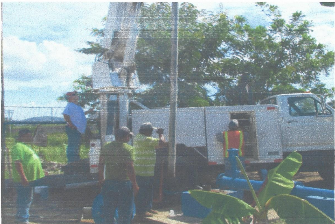
14.Instalación de tubo 4" HG en columna bomba #2 Col. Gran Villa.