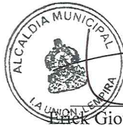
Erick Giovanni Reyes Cárcamo. Alcalde Municipal.