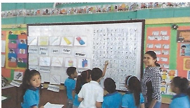
Clases Demostrativas CEB Lempira