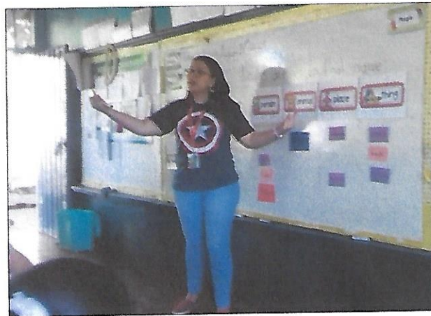
Clases demostrativas CEB Gabriela Mistral