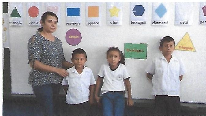
Clases Demostrativas CEB Gabriela Mistral