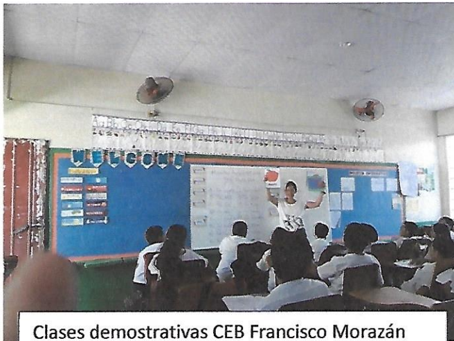
Clases demostrativas CEB Francisco Morazán