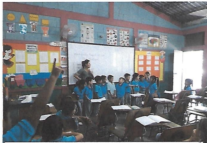
Clases demostrativas CEB Lempira