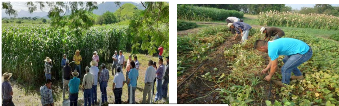
Siembra ensayo Sorgo