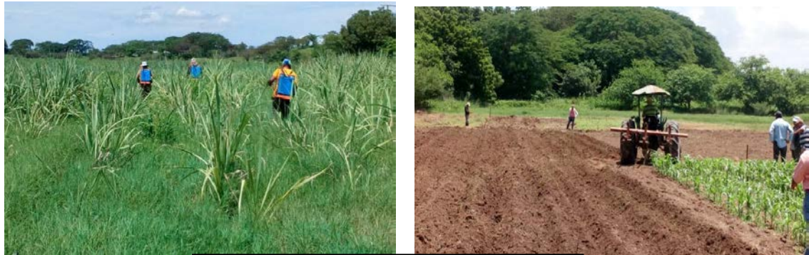
Fertilización cultivo Caña de Azúcar