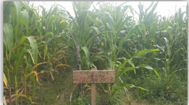
Ilustración 1 Lote demostrativo de dos variedades Maíz DICTA B02, B03