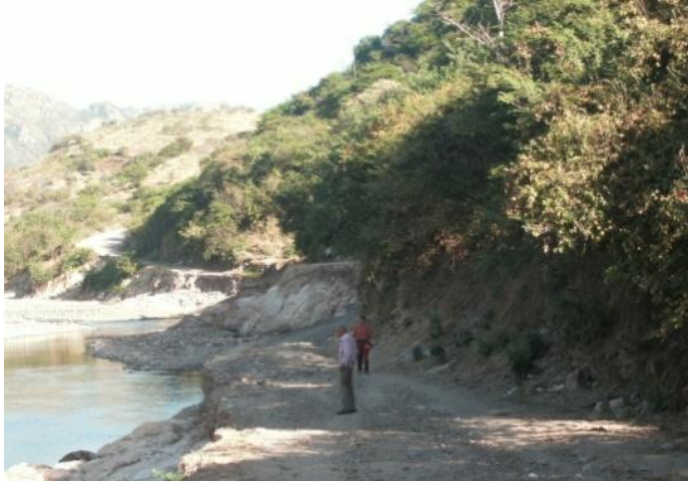
Carretera al margen del río- estuvo incomunicada