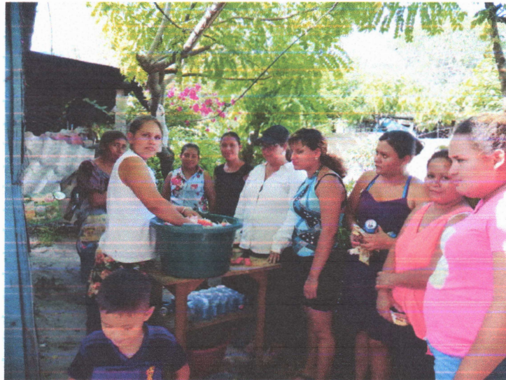
Fotografía III "Capacitaciones en el Bordo Río Blanco"