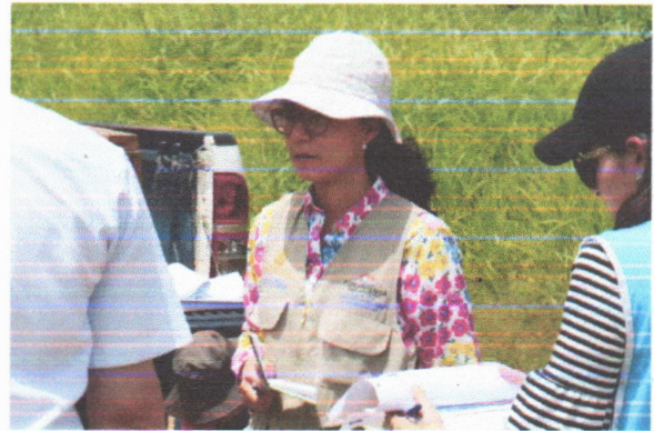
Fotografía II y III "Levantamiento de datos de campo e Inspección de los dos terrenos donde se van a construir los Parques,"