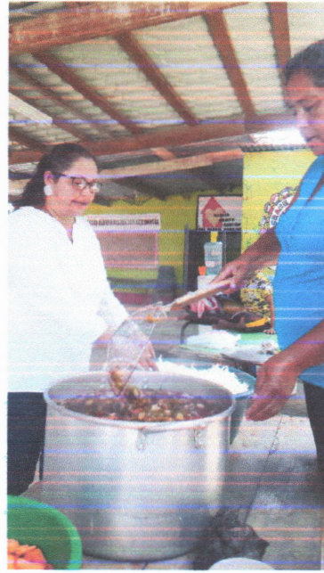
Fotografía III "Capacitaciones en el Bordo Río Blanco"