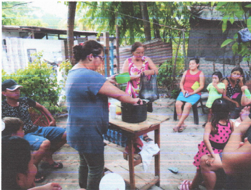
Fotografía II "Capacitaciones en el Bordo Río Blanco"