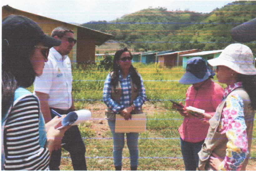
Fotografía I Reunión con el Equipo de la Dirección Nacional de Parques y Recreación, en la Res. Las Minas"