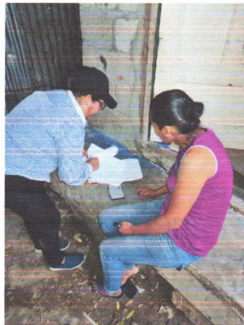
Fotografía III y IV "Levantamiento de Datos Socioeconómicos, de 50 familias del Bordo Río Blanco"