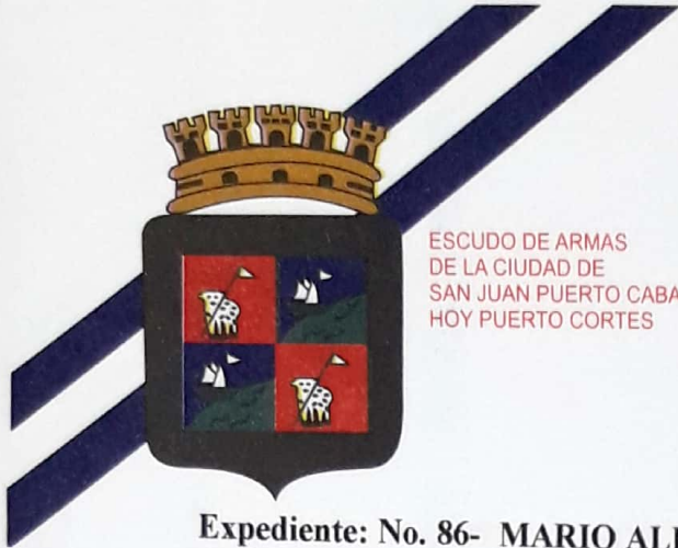
ESCUDO DE ARMAS DE LA CIUDAD DE SAN JUAN PUERTO CABALLOS HOY PUERTO CORTES

MUNICIPALIDAD DE PUERTO CORTES CORTES, HONDURAS, CENTRO AMERICA Tel. 2665-1004 / 5904 / 0412 Fax: 2665-0264 www.ampuertocortes.com